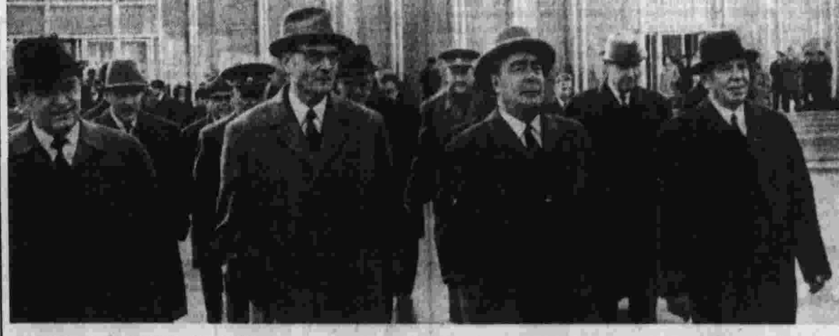
Проводы на Внуковском аэродроме.

30 сентября советская партийно-правительственная делегация сделала остановку в Ташкенте.