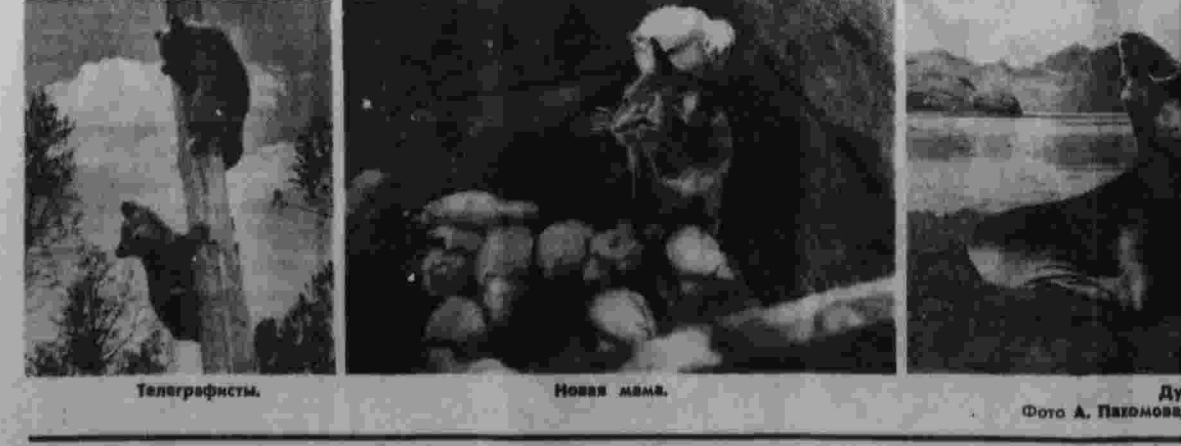
Улыбка фоторепортера. Дурт.

Сегодня в театрах КРЕМЛЕВСКИЙ ДВОРЕЦ СВЕЗДОВ — утро — Дон-Кихот; вечер — Концерт артистов Большого театра. ВОЛШЬИ ТЕАТР — Гастроли Венгерского государственного оперного театра (Венгрия, Народная Республика) — Иордания Попкев. Гастроли государственного театра им. Г. Сулеймана (в помещении Малого театра) — утр — Отелло; вечер — С вечера 10 полудня. МХАТ им. М. ГОРЬКОГО — в 10 и 14 час. — Синяя птица; вечер — Ревизор. ФИЛИАЛ МХАТ им. М. ГОРЬКОГО — утро — Три Туманана; вечер — Последняя. ЦЕНТРАЛЬНЫЙ ТЕАТР КУКОЛ — Большая зал — в 11 час. — спектакль Государственного Будапештского театра кукол Витая Янош в 4 часа и вечером — Необыкновенный концерт. ТЕАТР им. Е.Г. ВАХТАНГОВА — утро — Золушка; вечер — Человек из труины. БОЛЬШОЙ ЗАЛ КОНСЕРВАТОРИИ — Органет — Иван Соколов (Чехословакия) Социалистическая Республика), И.С. Вах. ТЕАТР им. МОССОВЕТА — утр — и вечер — Дуэлянт. ТЕАТР им. В.В. МАЛКОВОСКОГО — утр — Закон в пустыню; вечер — Мефел. КАКАЯ БУДЕТ ПОГОДА Сегодня днем в Москве и Подмосковье ожидается переменная облачность, утром и днем местами кратковременные дожди, ветер западный, усиленный, 15—17 градусов. В ближайшие двое суток в Москве и области местами дожди, ночью 5—10, днем 14—18 градусов.