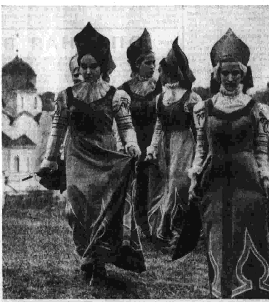
С любовью к природе