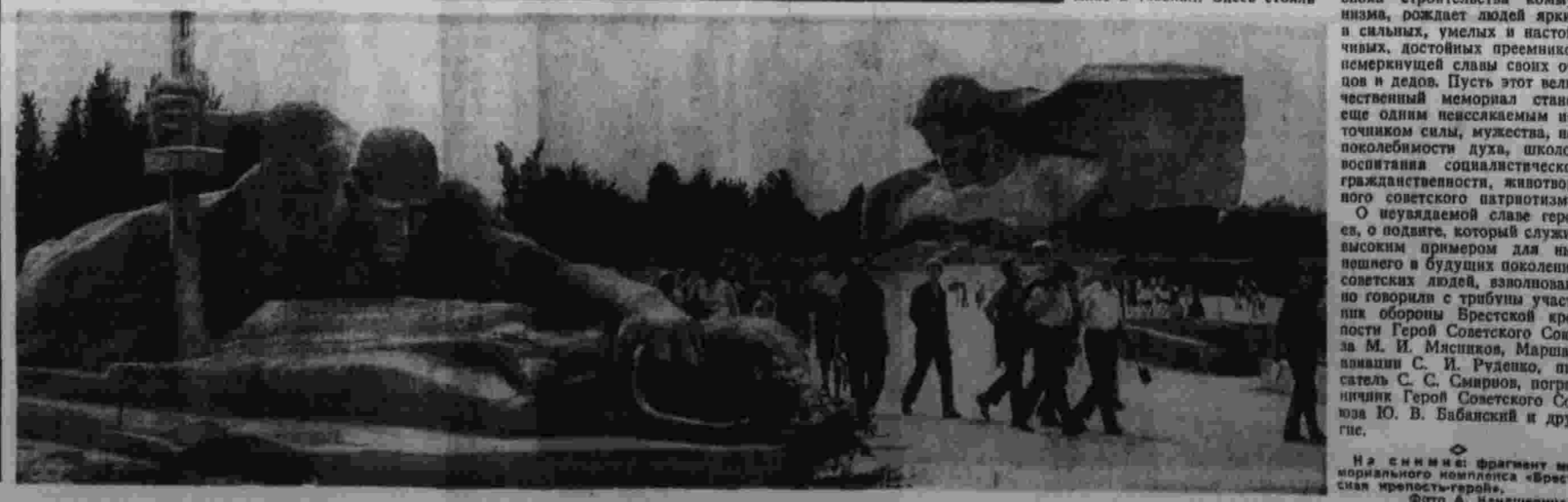
На снимке: фрагмент мемориального комплекса «Врестская крепость-герой».