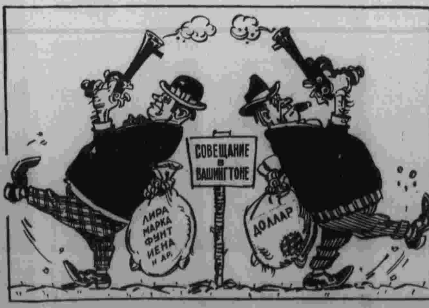
Дуэль, которой не видно конца... Рис. Ю. Кершина.

ДЕЛИ, 25. (ТАСС). На границе Индии с Восточным Пакистаном сохраняется сложная обстановка. По сообщению газеты «Таймс оф Индия», ожидается на индийскую территорию переместиться до 30 тысяч беженцев из Восточного Пакистана.