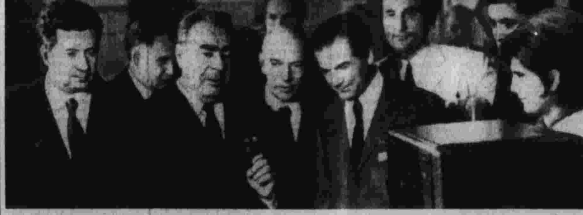
Л. И. Брежнев в одном из цехов Белградского завода электронной промышленности беседует с рабочими.

Л. И. Брежнев и И. Броз Тито обменялись на ужин речами.