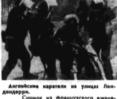
Английские каратели на улицах Лондондерри. Снимок из французского еженедельника «Юманите-дизанж».

прессы английских войск в католических гетто ссылаются на «насилие» и «террористическую деятельность». Все это в кризис в Ольстере он возложил на крадальскую республиканскую армию. Несмотря на то, что «теневой кабинет» лейбористов принял решение не ставить на голосование резолюцию, осуждающую политику правительства в Ольстере, представители левого крыла лейбористской парламентской фракции сделали это вопреки воле своих лидеров. В поддержку резолюции было подано 74 голоса, против — 203. Многие лейбористы воздержались при голосовании.