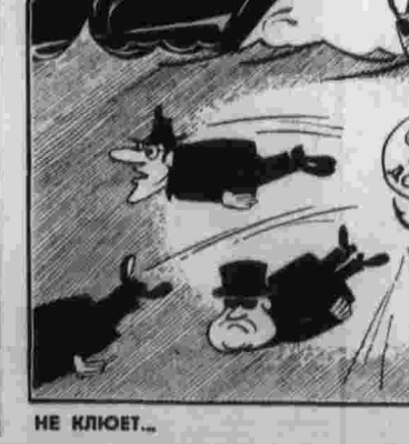
НЕ КЛЮЕТ... Рнс. В. Волков.