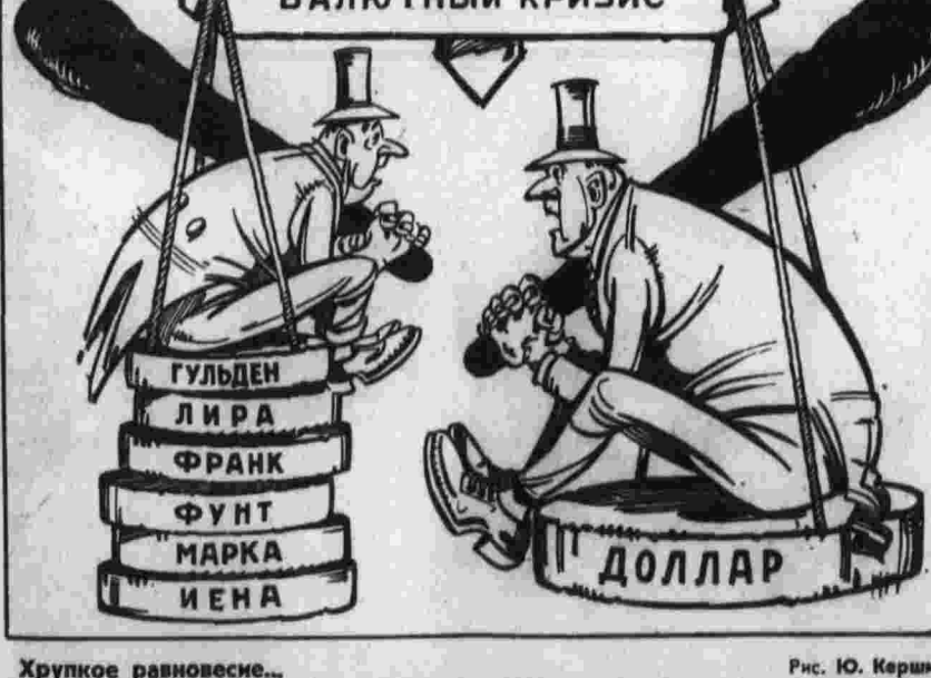
Хрупкое равновесие... Рис. Ю. Кершинка.