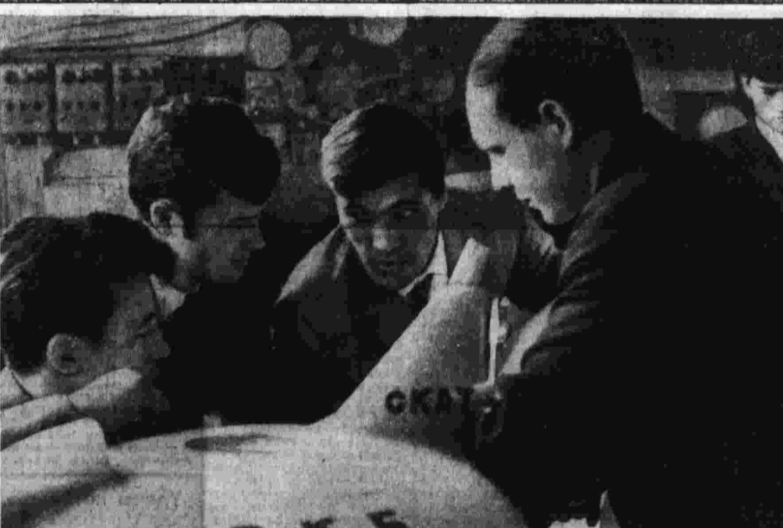
Студенческое конструкторское бюро Уфимского авиационного института объединяет молодых специалистов, питомцев этого вуза, инженеров, ученых. В его работе принимают активное участие и студенты-старшекурсники. На сцену СКБ