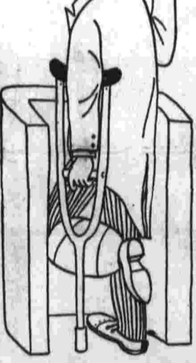
— Одно перелома мы уже добились. Рис. В. Тильманна.