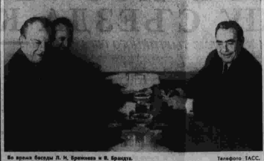
Во время беседы Л. И. Брежнев и В. Брандт.

процентов подскочили цены на многие товары, включая продукты питания. Преступность в Испании возросла на 9 процентов по сравнению с 1969 годом. ТАСС — Рейтер.