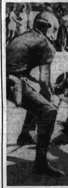
Антиковенные выступления в США несутся подавляющее большинство с участием демонстрантов в Сан-Франциско.

ных Штатах. На рассмотрение сенатской комиссии по иностранным делам представлена резолюция сената, которая предусматривает отмену принятой конгрессом в 1962 году кубинской резолюции и предполагает решительный пересмотр американской политики в отношении Кубы. Внесение этой резолюции отражает убеждение все более широких политических кругов и американской общественности в том, что политика изоляции и сдерживания — доказала свою несостоятельность. Председатель сенатской комиссии по иностранным делам Фулбрайт выразил свое сожаление по поводу отказа администрации вступить на более реалистичный путь. «Для многих американцев», — сказал он, — весьма важно, чтобы мы имели нормальные отношения с Кубой. По моему мнению, это соответствует нашим национальным интересам», — сказал он.