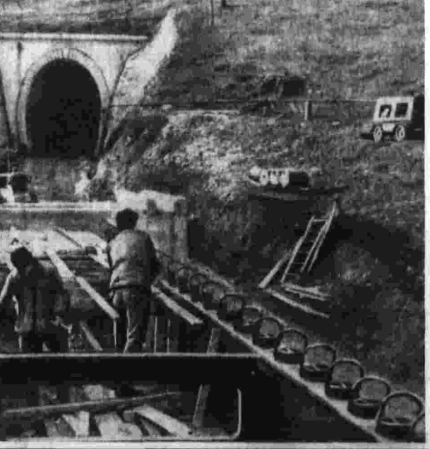
В Социалистической Федерации Югославия сооружают мосты через Бельград — Бар. Она свяжет столицу с недавно введенным в строй содеранным тоннелем Адриатического моря. На новой магистрали будет построено 258 километров, а также 217 километров строительства железной дороги.

Виктор МАЕВСКИЙ Политический обозреватель «Правды» наполнению меньше, чем в Австралии, меньше, чем в Италии или Бельгии. «Гуаская доктрина» В действии