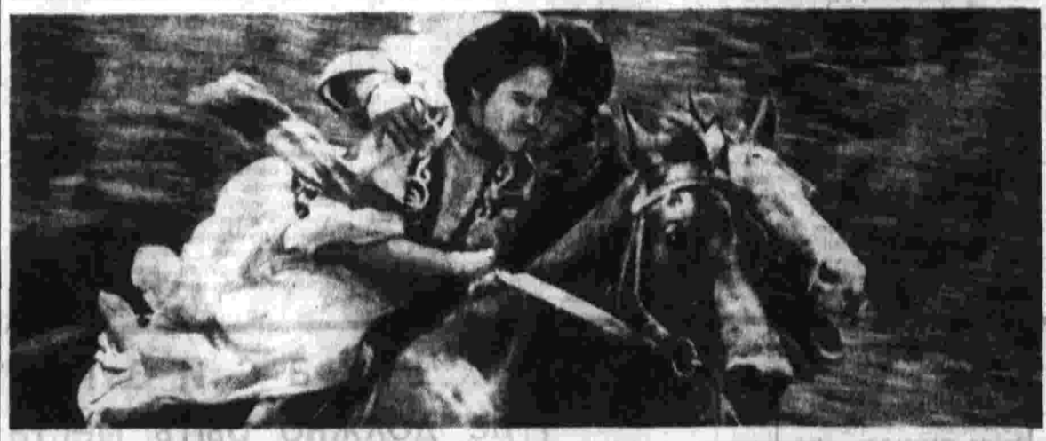
Это, наверное, с каждым из нас бывает встретится в жизни что-то такое хорошее, высокое, чистое, о чем нельзя умолчать, невозможно оставить при себе.