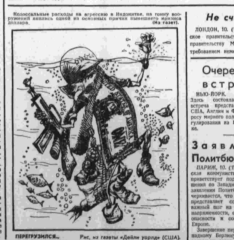
Рис. из газеты «Дейли уорлд» (США).

Колоссальные расходы на агрессию в Индонезии, на тоны вооружений явились одной из основных причин кризиса мизиса доллара.