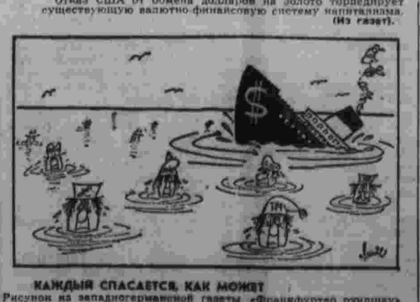
КАМДЫЙ СПАСАЕТСЯ, КАК МОЖЕТ. Рисунки из западногерманской газеты «Франкфуртер Трунджунг».

ЛОНДОН. 9. (ТАСС). Под нажимом общественного мнения и по требованию лейбористской оппозиции правительство консерваторов приняло сегодня решение отозвать на два дня — 22 и 23 сентября — распушенный на летние каникулы парламент для обсуждения положения в Ольстере в связи с обостряющейся там обстановкой.