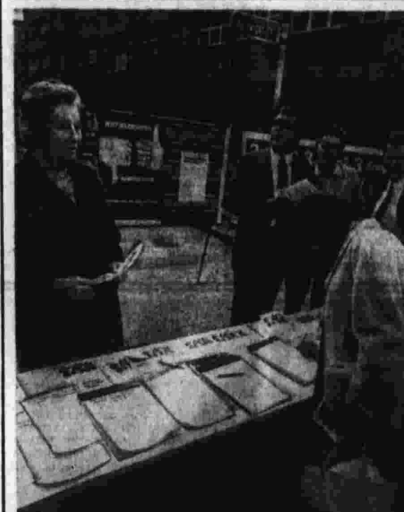
Широкие круги общественности ФРГ выступают за скорейшую ратификацию договоров, подписанных с Советским Союзом и Польшей. «Гражданские инициативы» — так называются местные объединения граждан, разрабатывающих свои подписей под соответствующим обращениями и бюджетами. И а с м и в информационный стенд и сбор подписей на район в улич Г. Эссен.