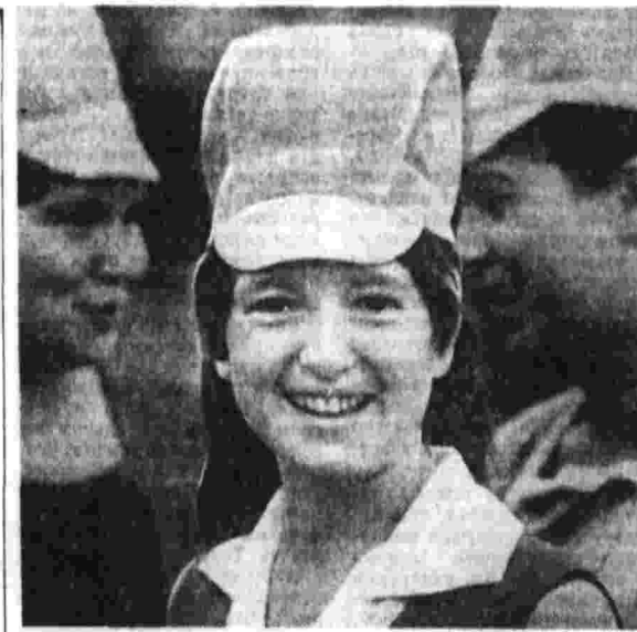
С начала года химини Каунасского завода искусственного волокна имени 50-летия Октября выдала сверх задания 48 тонн искусственного волокна.

С большим интересом изучают горняки рудника имени XII съезда КПСС Зырянского свинцового комбината.