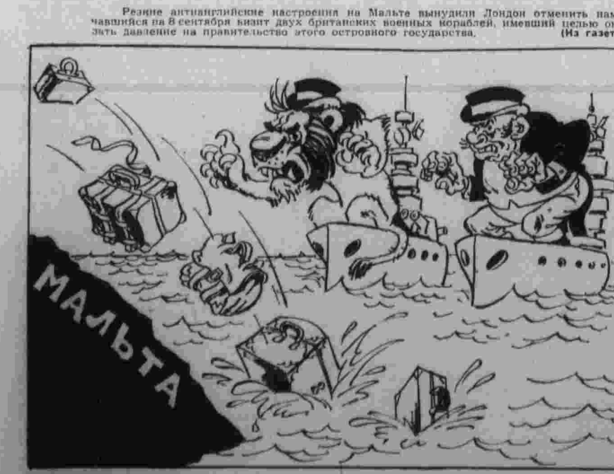
ОТ ВОРОТ ПОВОРОТ.

Почему же капиталисты не жалуют таких денег, почему они отыраивают от текущих дел фирмы и сажает за парты республиканских боссов, почему, наконец, совершенствованию управления стало сейчас одним из главных направлений экономической политики государственно-монополистического капитализма в США? В использовании современных методов управления монополиями видят средство сохранить и упрочить исторически сложившийся капиталистический строй, приспособиться к условиям научно-технической революции, борьбы социализма и капитализма на мировой арене, обострения классовой борьбы в мире капитала, а одновременно — обеспечить новые максимальные прибыли. В центре современных теорий и практик управления в США — notions «человеческого поведения», решение вопросов «конфликтов и сотрудничества», преодоления «коммуникационных барьеров», «стимулирования и труда» и т. д. И это не случайно, ведь современное производство, научно-техническая революция все больше выдвигают на первый план вместо физических духовные силы трудящегося.