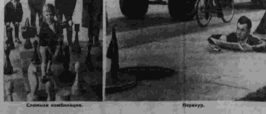
Спокойная комбинация. Перенур. Неполая дрова...