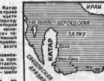
Иран, Ирак, Персидский залив, Арабия, Южная Аравия, Оман, Йемен, Саудовская Аравия, Кувейт, Бахрейн, Катар, Эмираты ОАЭ.

Китайское руководство тем более не могло не сознавать всю глубину своего поражения и краха своих планов, когда международное Социалистическое движение коммунистических и рабочих партий 1969 года в Москве вновь подвернуло миролюбивую верность мирового коммунистического движения марксизма-ленинизма, пролетарского интернационализма и пролетарского единства коммунистических партий на этой принципиальной основе.