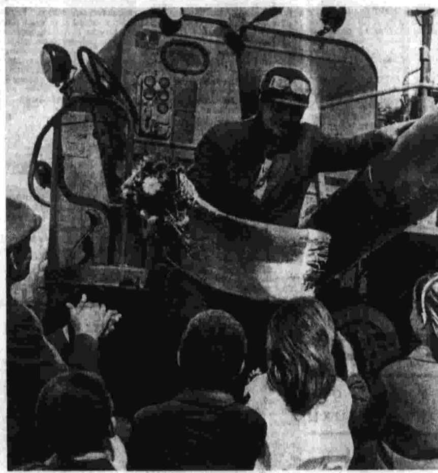
Центральный Комитет КПСС

Скорейшее вступление в силу этого важного соглашения означало бы интересам всех народов. Его подписание укрепляет их надежды на положительное решение и других неурегулированных и назревающих проблем европейской и мировой политики, на превращение Европы в зону прочного мира, в район равноправного и взаимовыгодного сотрудничества.