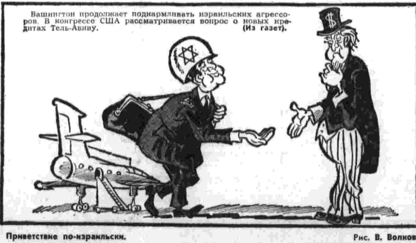
Приветствие по-кларнльски. Рис. В. Волкова.

Швейцарии, «принимая во внимание развитие международной политической обстановки, решило признать Демократическую Республику Вьетнам и таким образом придать официальный характер существующим отношениям».