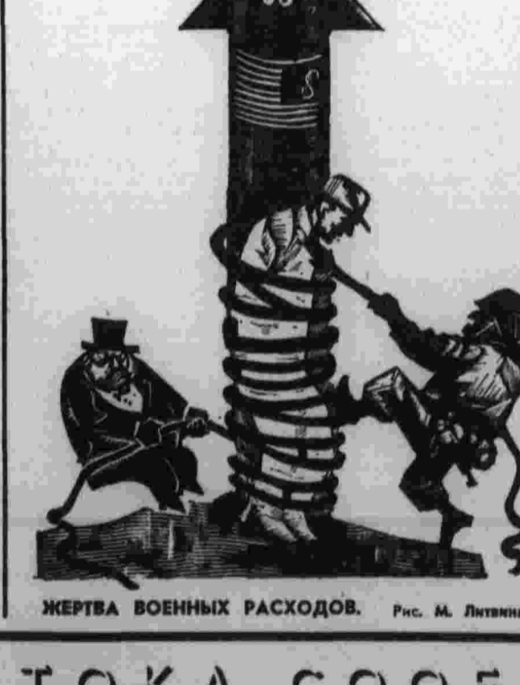
ЖЕРТВА ВОЕННЫХ РАСХОДОВ. Рис. М. Литвина.

«Демократия наизнанку» — так прокомментировала сенатор М. Мэнсфилд предвыборный фарс в Южном Вьетнаме. По мнению сенатора, полный выход американских войск из Юго-Восточной Азии является «единственным ответом на спектакль в президентских выборах». Афинский режим продолжает поддерживать правящие круги США. Недавно эскортно-морской банк США принял решение о предоставлении займа в сумме 128 тысяч