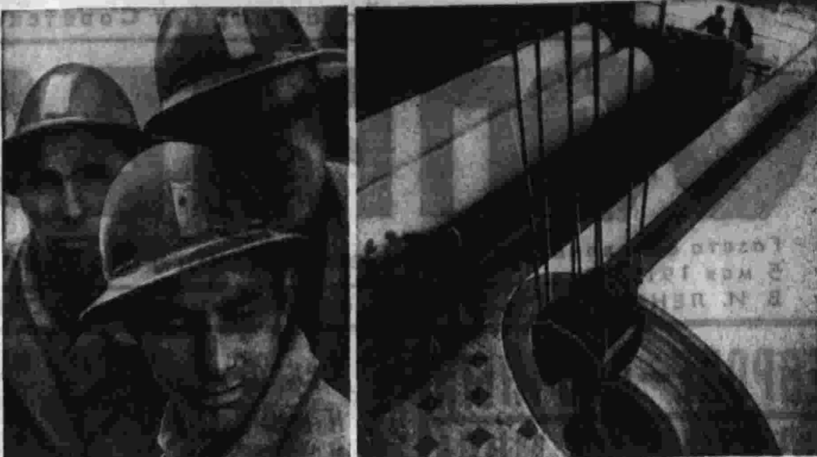
В эти дни труженики Коми АССР работают с особым подъемом: республика отмечает свой юбилей. Эти снимки только что доставлены нашим фотокорреспондентом В. Яковенком: слева — буряльщики самой глубокой в Вуктыле скважины; справа — шумный цех Сыктывкарского лесопромышленного комплекса.

отеки и клубы, родились национальный балет и опера. Издаются 21 газета, литературно-художественный журнал «Северная звезда». Полувековой путь, пройденный нашей республикой в дружной семье советских народов, поистине грандиозен. Еще прекраснее ее перспективы, которые открыл XXIV съезд КПСС. Трудящиеся Коми республики под руководством областной партийной организации с большим подъемом взялись за выполнение задач девятой пятилетки. Преступить вать новые рубежи: довести добычу природного газа до 15—16 миллиардов кубометров и каменного угля до 23 миллионов тонн в год, в три раза увеличить добычу жидкого топлива, в несколько раз — производство целлюлозы, бумаги и картона. В авангарде борьбы за претворение в жизнь решений XXIV съезда партии идет