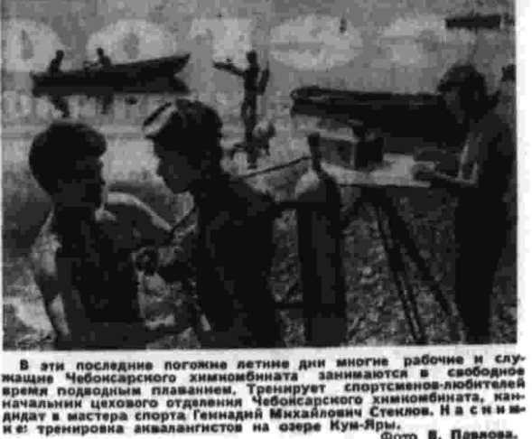
В эти последние последние дни многие рабочие и служащие...