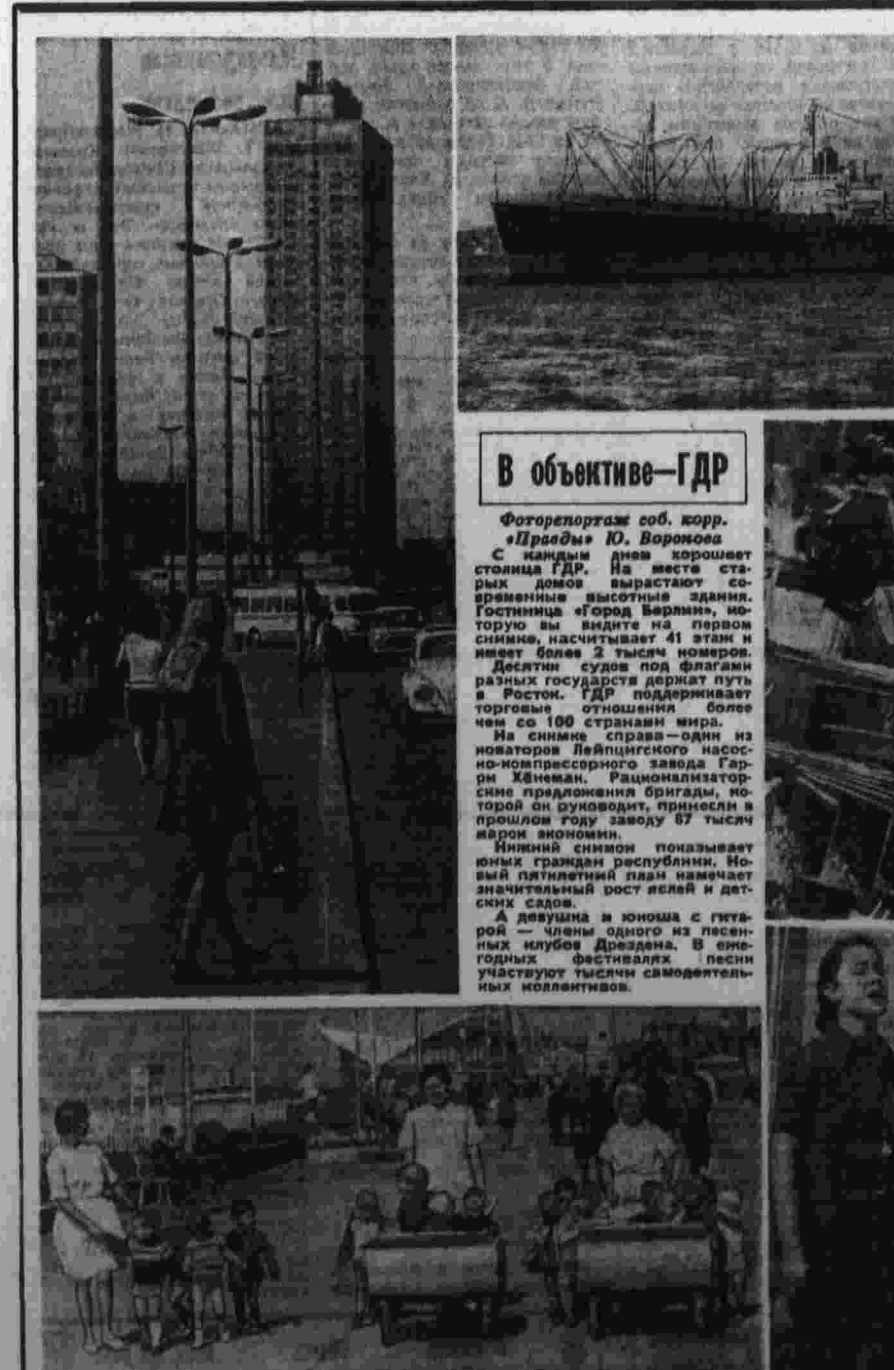
В объективе ГДР

Что же касается монополий, то многие из них успели ввести новые завышенные це-