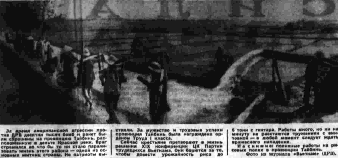
За время американской агрессии против ДРВ десятки тысяч бомб и ракет были сброшены на провинцию Тайбинь, расположенную в южной части страны. В результате на территории Тайбинь разрушены XIX конференция ЦК Партии трудящихся Вьетнама. Они борются за то, чтобы довести урожайность риса до 5 тонн с гектара. Работы много, но ни минуты не расстает труженники с винтовкой — в любой момент следует ждать вражеского налета. Притворяться в минувшие дни тайбиньцы не смели: полные работы на рисовых полях в провинции Тайбинь.