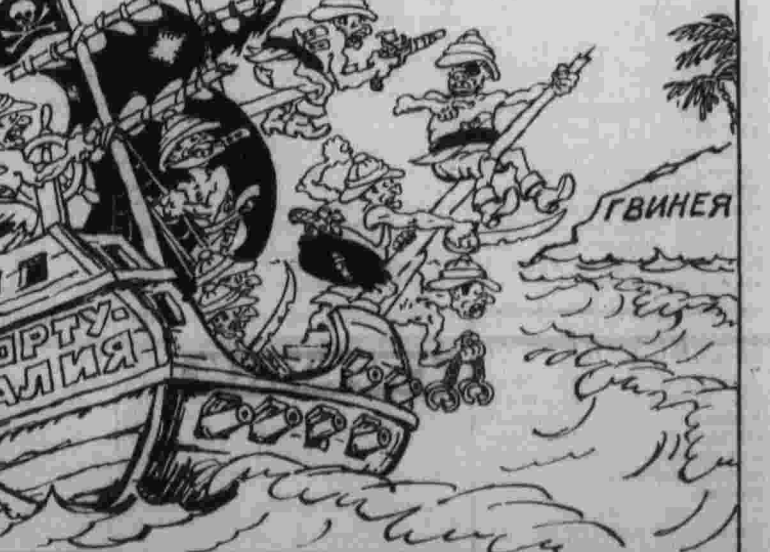
Лиссабонские пираты. Рис. А. Банамова.

Нью-Йорк, 9. (ТАСС). Агентство Синьхуа распространило сообщение о том, что КНР, которое отклоняет советское предложение о созыве конференции пяти ядерных держав. Как известно, это предложение содержится в заявлении Советского правительства, врученном правительством США, КНР, Франции и Великобритании. В нем подчеркивается необходимость настоящих усилий, чтобы принять действенные меры, ведущие к ядерному разоружению. Советская инициатива была встречена с большим удовлетворением самой широкой международной общественностью, а также в правительствах многих других государств.