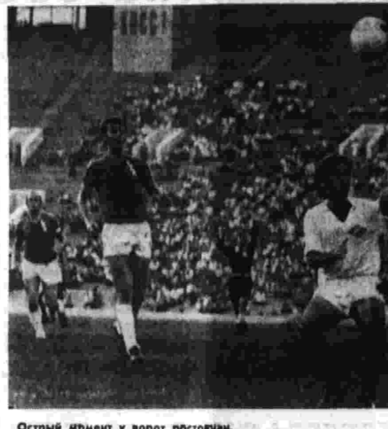
Острый момент у ворот ростовчан.

Тепла забрать меня по суду, все сельские на защиту. Даже в суд ходила. А когда я вышла замуж и приехала туда, чуть ли не в каждом доме застало было. По старому казахскому обычаю мужу, как дорожному гостю, подносили баранью голову... Это в знак уважения ко мне, русской девочке, выросшей в казахском селе. Разве можно такое забыть? Вечером мы ходили по городу. Постоили у новых зданий, которые, мне кажется, всегда хранят тепло рук тех, кто их любовно создавал. — Вот, видите, тот корпус, — сказала Катерина. — История тут была с моим блоггером. Он с самого начала знал, что есть на свете белый-белый хлеб, как-то отец даже привозил кусочек — такой вкусный, душистый... И вот сейчас она видит, как женщина отрезает от сказочной белой плетени несколько тонких ломтиков, а остальные — в корзинку поджаристой корочкой. В те годы в деревне трудно было хлебом. Но Катя знала, что есть на свете белый-белый хлеб, как-то отец даже привозил кусочек — такой вкусный, душистый... И вот сейчас она видит, как женщина отрезает от сказочной белой плетени несколько тонких ломтиков, а остальные — в корзинку поджаристой корочкой. В те годы в деревне трудно было хлебом. Но Катя знала, что есть на свете белый-белый хлеб, как-то отец даже привозил кусочек — такой вкусный, душистый... И вот сейчас она видит, как женщина отрезает от сказочной белой плетени несколько тонких ломтиков, а остальные — в корзинку поджаристой корочкой.