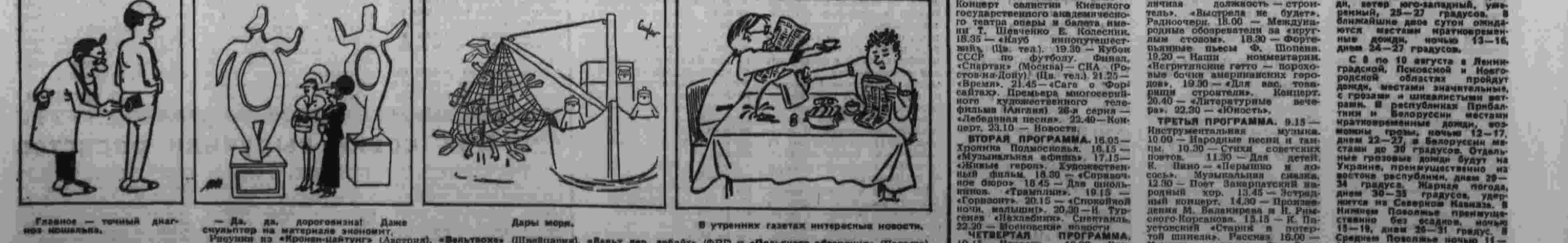
Дары моря. В утренних газетах интересные новости. «Вальтасек» (Швейцария), «Валет дер арбайт» (ФРГ) и «Польского обозрения» (Польша).