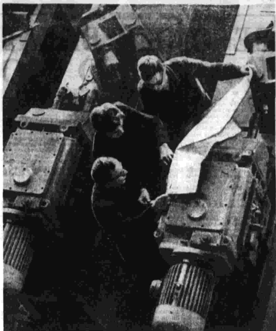
На многих предприятиях страны работают автоматические линии, выпущенные Краснодарским экспериментальным станкостроительным заводом имени Калинина. Сейчас здесь начался монтаж новой автоматической линии. Трудники завода активно включились в социалистическое соревнование за досрочное выполнение заданий первого года девятой пятилетки.