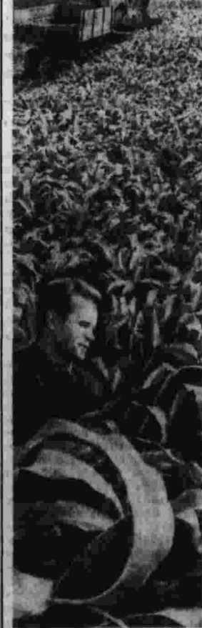
На опытной поля Ульяновского сельскохозяйственного института началась уборка кукурузы. Каждый гектар дает по 350 центнеров зеленой массы. Вслед за комбайном на поле вышли трактористы — начались дискование и пахота почвы для второго посева.