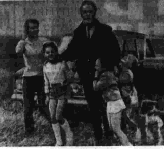
Жюри завершает работу в Москве VII Международного кинофестиваля. Здесь показаны кадры из победительных конкурсов. На снимке — картина «Белая птица с черной отметиной» (кадр слева). На конкурсе детских фильмов Золотой приз присуджен также советской картине «Внимание, черепаха!» (кадр из фильма — справа).