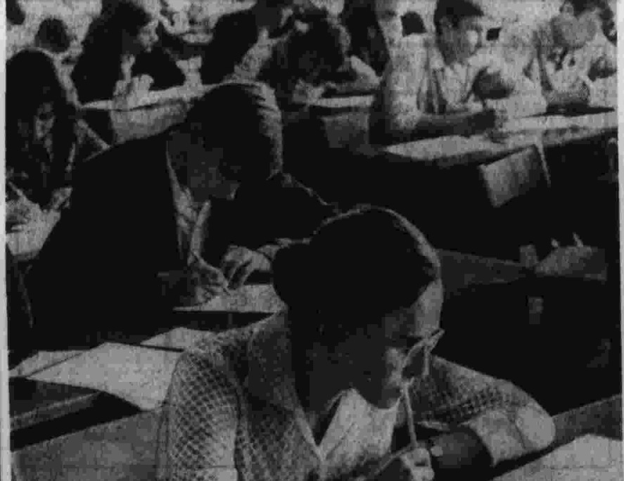
Вчера в вечерних учебных заведениях страны начались призывные экзамены. В этом году на первые курсы институтов и университетов будет принято более 900 тысяч юношей и девушек, из них свыше 500 тысяч — на дневные отделения. На снимке: экзамен по физике в Московском автомобильном-дорожном институте.

Уроки ведут ученые НОВОСИБИРСК, 2. [Корр. «Правды» В. Евлахов]. Сегодня в Академгородке начался летний в летней физико-математической школе. Это ее девятый сезон. Победители двух первых туров всеозонных олимпиад — около 600 старшеклассников из разных районов Сибири и Дальнего Востока собрались в научном центре на заключительный тур олимпиады. Те, кто успешно выдержит это последнее испытание, продолжат обучение в специализированной школе при Новосибирском университете. А сейчас ребята три недели будут слушать лекции и беседы известных ученых, знакомиться с исследовательскими институтами, защитят фантастические проекты и, конечно, отдыхать на берегу Обского моря.