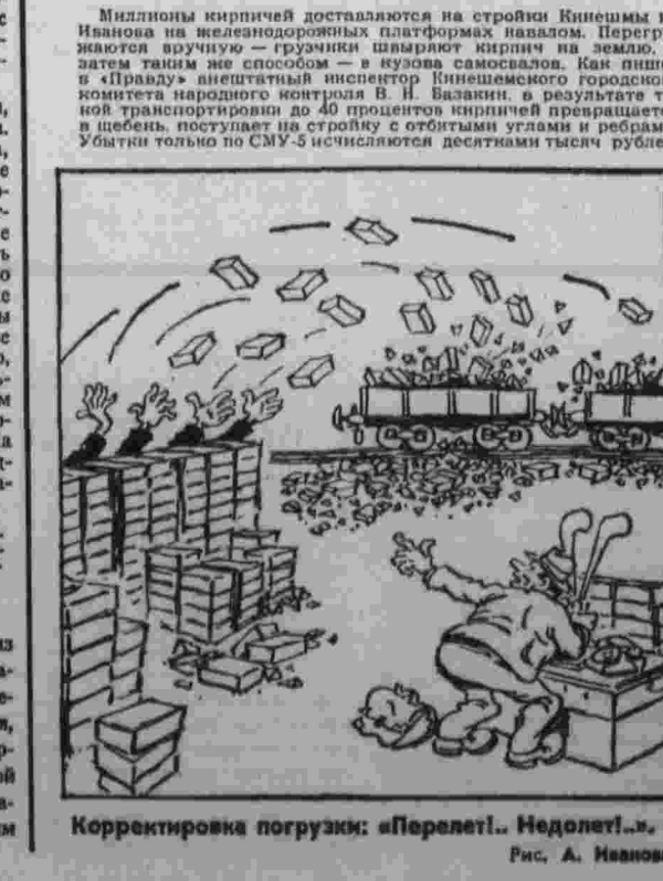
Корректировка погрузки: «Перелет!». Недолет!... РИС. А. МАВНОВА.

Более полтора тысяч тонн известковых удобрений лежит под открытым небом на железнодорожной станции Талица. Из них 450 тонн привалелат колхозу «Урал» Слободино-Турунского района. Лечат они с марта прошлого года, много раз были под дождем, пришли в полную негодность. Об этой бесхозяйственности мы сообщали в районные и областные организации, но безрезультатно. Д. ОВЧИННИКОВ, Член группы народного контроля, дежурный по станции Талица, Свердловская область.