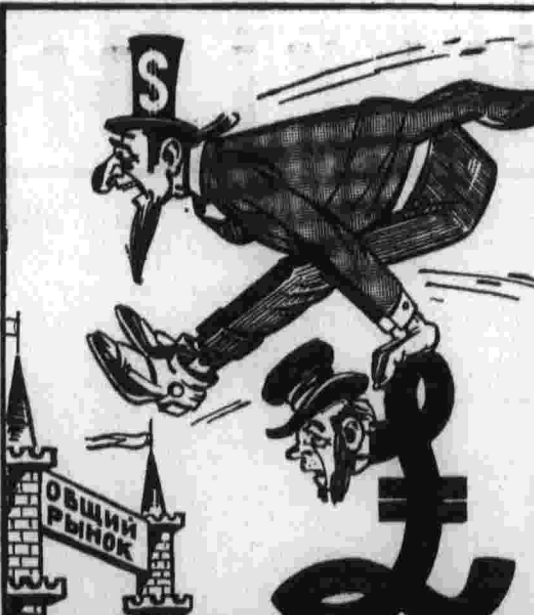
Сторона для прыжка. Рис. Ю. Кершина.

Нью-Йорк, 28. (Соб. корр. «Правды»). Не так-то уж часто увидишь в Нью-Йорке очередь у книжного магазина. Но в этот день на углу Пятой авеню и 53-й улицы у дверей магазина «Даблдой» люди собирались еще до его открытия.