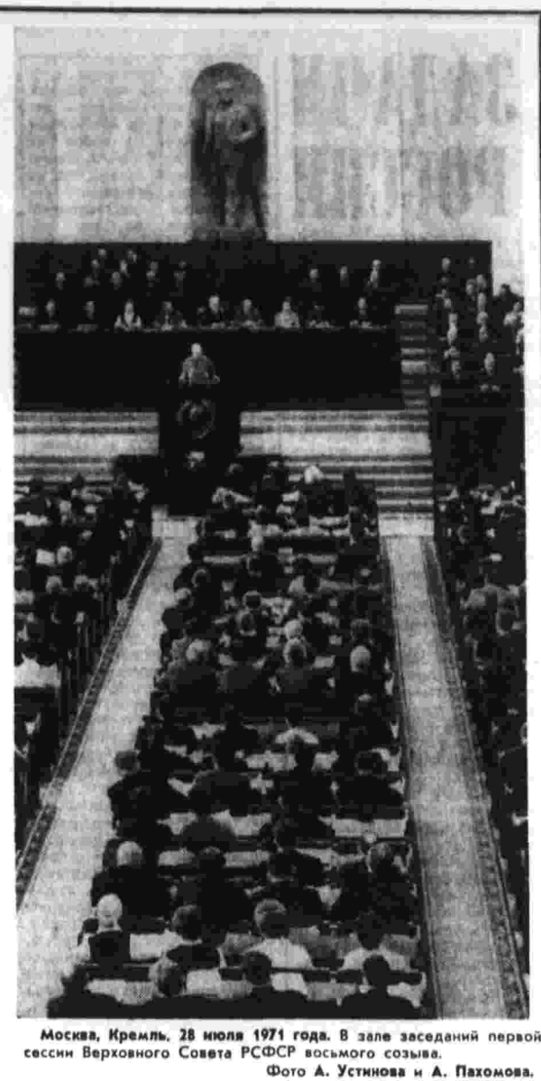
Москва, Кремль, 28 июля 1971 года. В зале заседаний первой сессии Верховного Совета РСФСР восьмого созыва.

Депутаты единогласно принимают постановление, в котором одобряется деятельность Совета Министров РСФСР. Этим постановлением Председателем Совета Министров РСФСР назначен М. С. Соломенцев. Ему поручено представить Верховному Совету РСФСР предложения о составе правительства РСФСР. Совету Министров РСФСР поручено продолжать выполнение своих обязанностей в предельно короткий срок образования Верховным Советом РСФСР правительства Российской Федерации. Сессия переходит к рассмотрению второго вопроса повест-