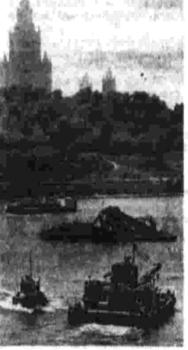
года назад у завода имени Бадаева. Землетрясение уходит все ниже по течению. Углубление со дня на день 60 тысяч кубометров осадков. И вот теперь новый черпак грунт у Лужников. Здесь снимается сценарий «Янтари».

Они приехали из разных стран. Они принадлежат к разным поколениям кинематографистов. У них различные политические взгляды. Но все они — участники дискуссии «Кино в борьбе за социальный прогресс», проходившей в Советском кинематографистам.