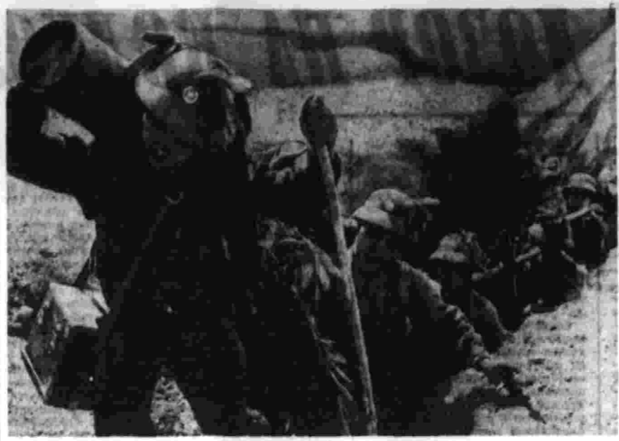
Быть всегда готовым к отпору американским агрессорам — одна из главных задач народа Демократической Республики Вьетнам. Надежным защитником мирного труда населения страны являются вооруженные силы ДРВ. На снимке: бойцы вьетнамской Народной армии на учениях.