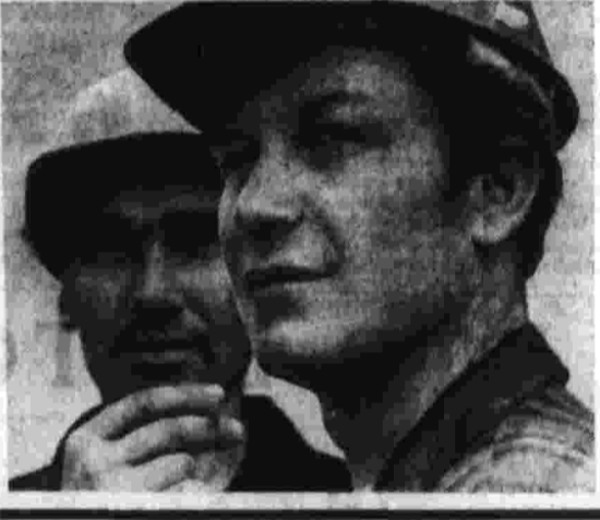
В. Ф. Гарбузов, заместитель министра иностранных дел СССР

Лиепая На металлургическом заводе «Сарклайс металлурги» недавно вступила в строй действующих турбин установка непрерывной разливки стали. На ней в период горячего обробования достигнуты высокие показатели. Государственная комиссия приняла весь комплекс, необходимый для нормальной работы установки.