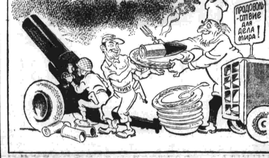
«Продпункт» дяди Сэма.

Американская программа «продовольствие для дела мира» в действительности служит каналом для дополнительных долларовых инъекций марionеточному сайгонскому режиму с целью укрепления его военной мощи.