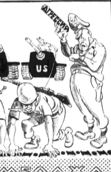
Сайгонские наемники при поддержке американской авиации готовят новые авантюры против Камбоджи. (Из газет.)

«Сколь бы трудной ни была проблема, с которой столкнулся Индия в результате нападения миллионов восточноазиатских бензенов», — заключила премьер-министр, — мы разрываем ее, если будем едины».