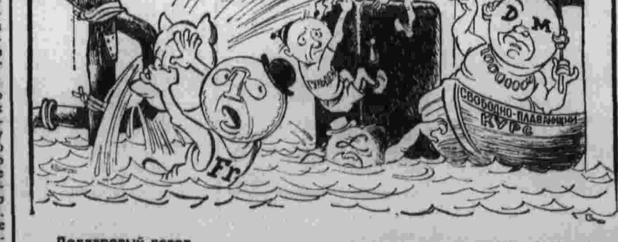
Долларовый потоп. Рис. В. Фоменко.

Кризис валютно-финансовой системы капиталистического мира продолжается. Обесценивание доллара и связанных с ним многих других валют стало очевидным фактом.