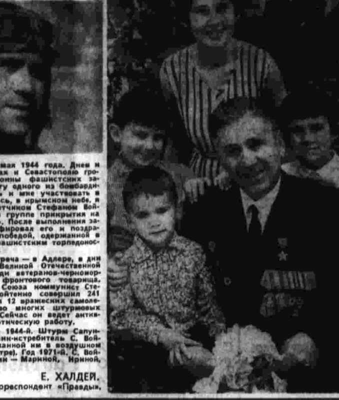
Е. ХАЛДЕЙ. Фотокорреспондент «Правды».