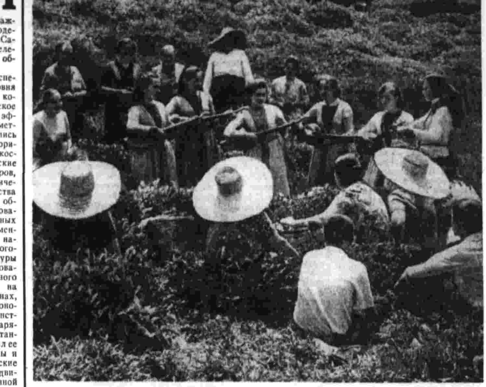
На живописных землях распахнулись зеленые плантации колхоза села Итиспирис Махарадзевского района Грузинской ССР. Чай — основное богатство хозяйства. Под этой культурой здесь занято 180 гектаров. Часовым досрочно выполненными майскими и июньскими заданиями колхозу удалось продать государству уже 50 тонн чайного листа — это половина годового обязательства. На с и м и н: участники художественной самодеятельности выступают с концертной программой перед часовыми.

Полученные результаты свидетельствуют, что значение беспрепятственного многодневного полета первого экипажа орбитальной станции трудно переоценить. Проверка в дей-