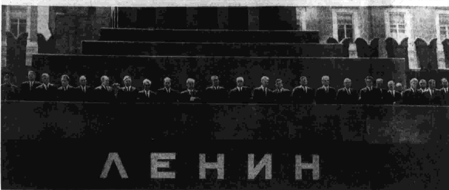
Москва, 2 июля 1971 года. Траурный митинг на Красной площади. На трибуне Мавзолея В. И. Ленина.

Газета основана 5 мая 1912 года В. И. ЛЕНИНЫМ Орган Центрального Комитета КПСС № 184 [19327] Суббота, 3 июля 1971 г. Цена 3 коп.