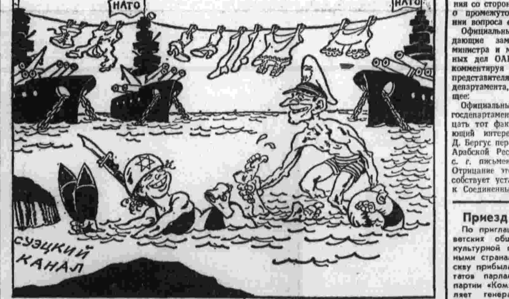
Рис. А. Баженова.

ВАШИНГТОН, 2. (ТАСС). Правительство США предпринимает новые маневры с целью помешать Китаю опубликовать материал Пентагона об агрессии во Вьетнаме. Об этом свидетельствуют