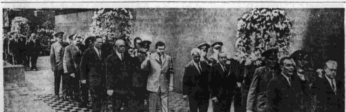
Руководители партии и правительства несут урны с прахом Георгия Тимофеевича Добровольского, Владислава Николаевича Волкова и Виктора Ивановича Пацаева к Кремлевской стене.