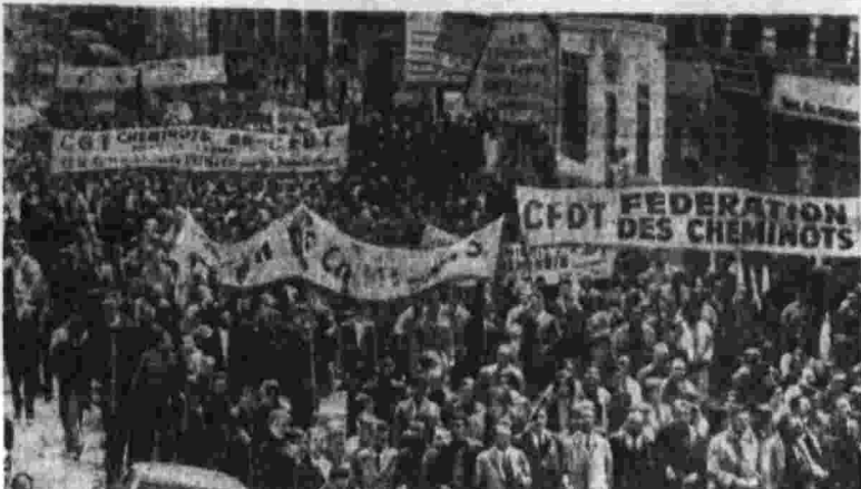
Миллионеры Франции ведут упорную борьбу за улучшение своего материального положения и условий труда. «Битва на колесах» назвали французские газеты движение товарных и грузовых вагонов. На с и и и: Бастующие просят по улицам Парижа.

ЛОНДОН. Лейбористская оппозиция подвергла резкой критике экономическую политику английского правительства во время прений в палате общин и внесла резолюцию, выражающую недоверие правительству в связи с проводимой им экономической политикой. За год пребывания консервативного правительства в власти экономика Англии стала испытывать еще большие трудности, чем во время пребывания в власти лейбористов. Растет армия безработных, численность которой прибли-