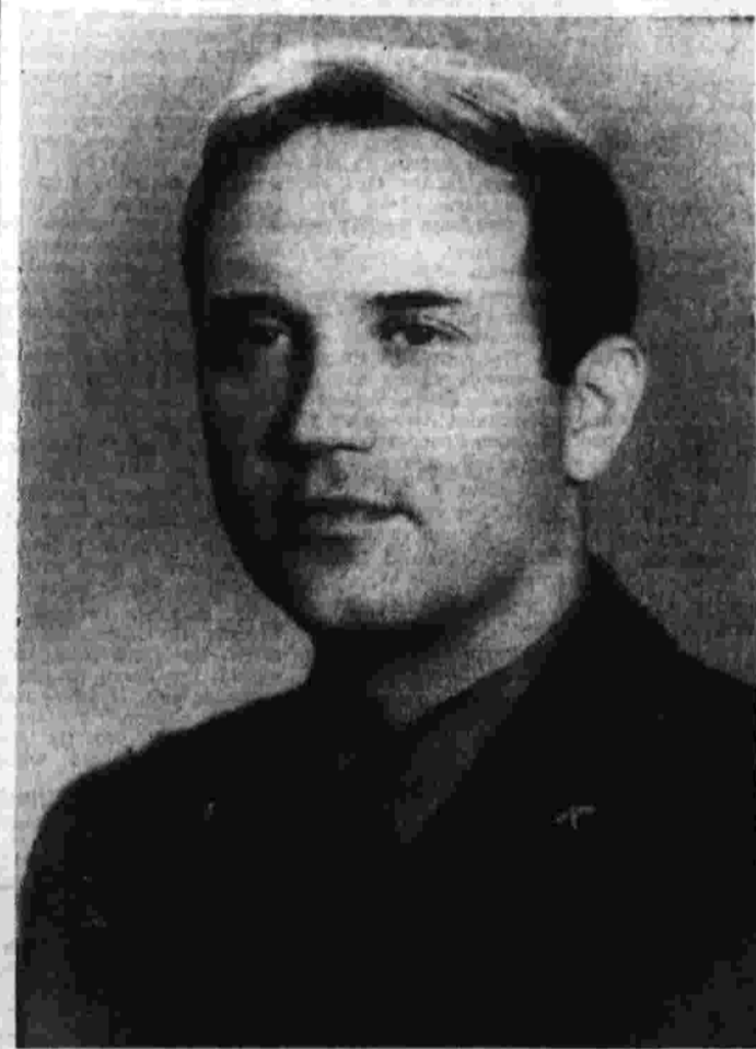
Георгий Тимофеевич Добровольский.

Весь советский народ, все прогрессивное человечество глубоко скорбят в связи с безвременной утратой героев-космонавтов, внесших своей отважной творческой работой крупный вклад в развитие исследований звездного океана.