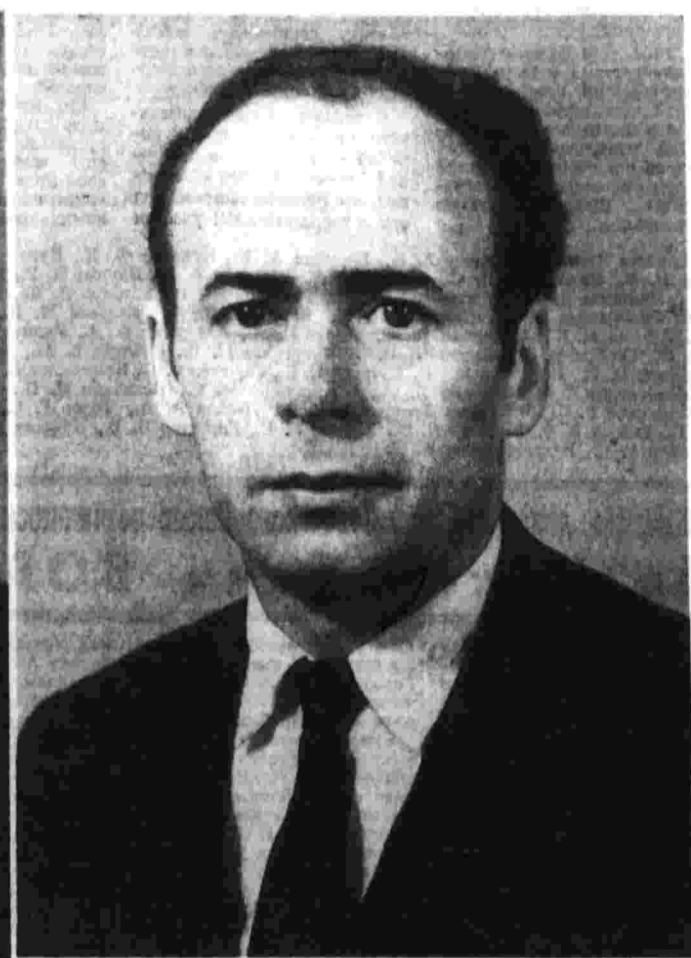
Виктор Иванович Пацаев.