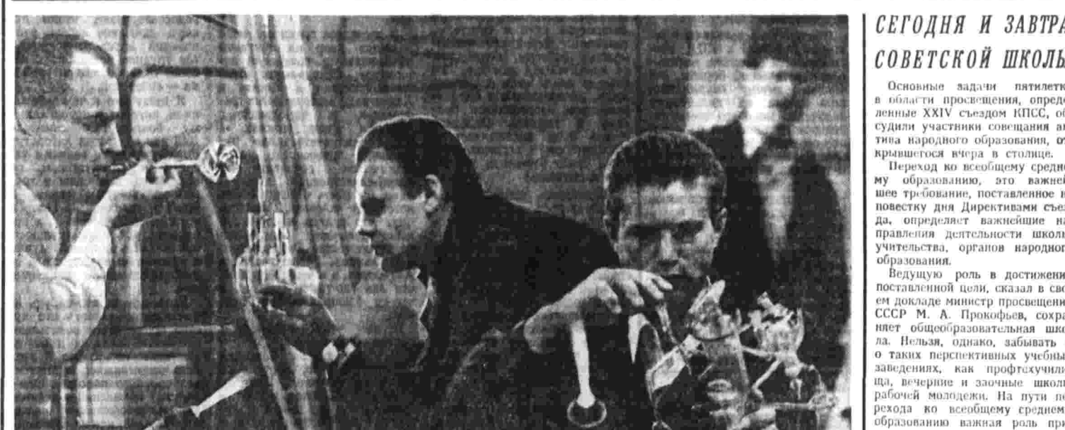
В лабораториях и мастерских Научно-исследовательского физико-химического института имени И. Я. Карпова много хороших мастеров-стеклодувов. Они создают сложные приборы,