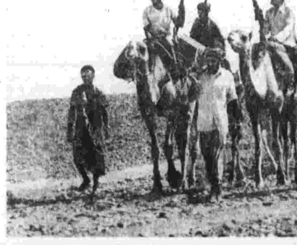
В объективе — Дофар.

Идеологические диверсанты рассуждают на несомненно логичном заглядном читателя, но в своем увлечении они забывают, что таким образом они лишь сбывают в толку обыкновенного человека, инстинкты которого подсказывают, что Горький, Маяковский, Блок, Серофинициан и другие писатели не являются представителями буржуазии, а являются представителями пролетариата.