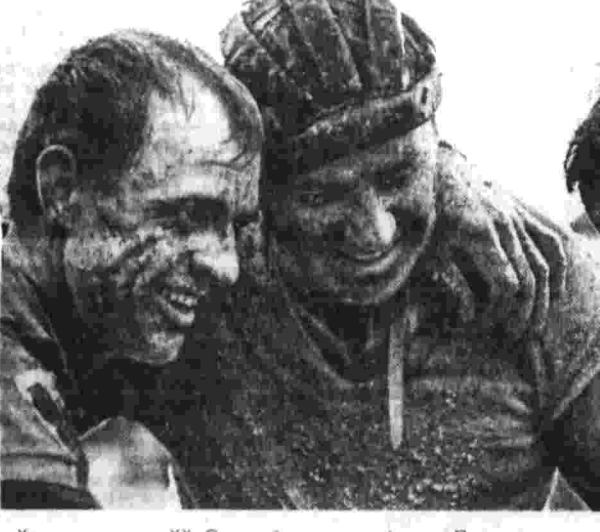
Хотя до начала XX Олимпийских игр в Мюнхене еще более года, но первые олимпийские трофеи — уже в нашей стране. На прошлой неделе журн. Международной олимпиады фотографировали в Мюнхене удостоенные золотой и серебряной медалей, двух почетных призов и диплома фотографа, двух почетных призов и диплома фотографа, двух почетных призов и диплома фотографа, двух почетных призов и диплома фотографа.

Вильнюс, 28. (ТАСС). Тяжелая утрата постигла сегодня писательскую организацию Литвы. После продолжительной, тяжелой болезни на 66-м году жизни скончался Антанас Венцлова, народный писатель Литовской ССР, член президиума Союза писателей СССР, член-корреспондент Академии наук Литовской ССР, лауреат Государственных премий СССР и Литовской ССР. Литературная деятельность А. Венцловы продолжалась свыше 45 лет. Его перу принадлежат около 70 томов поэзии, прозы, научных трудов. Писатель-коммунист, А. Венцлова неоднократно избирался депутатом Верховных Советов СССР и республик, он долгие годы возглавлял писательскую организацию Литвы.