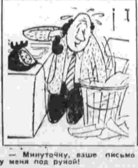
— Минуточку, ваше письмо меня под рукою!