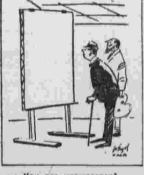
— Как это называется? — Годов в сигнале.