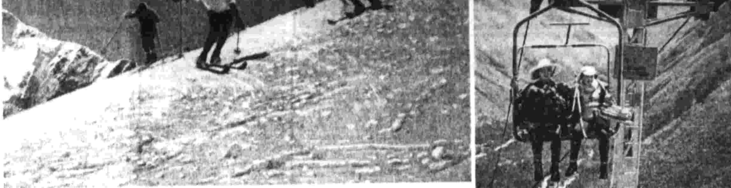
Приезжайте в Приэльбрусье