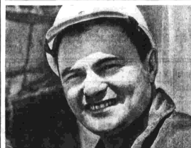
Начата разведка нефти и газа на глубине до 7 тысяч метров

По данным телеметрической информации, температура, давление и газовый состав атмосферы на станции поддерживаются в заданных пределах. Самочувствие космонавтов хорошее.