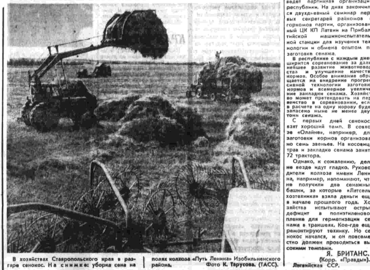
В хозяйствах Ставропольского края в разгар сенокоса. На снимке: уборка сена на полях колхоза «Путь Ленина» Изобильненского района.

ПАРТИЙНЫЕ выписки вложены на председателя местного комитета профсоюза Радзича и секретаря партбюро Любых.