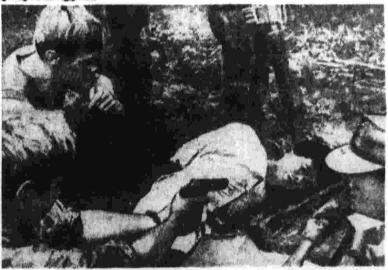
Снимки из журнала «Луг» и газет «Дейли Уорлд» и «Экспресс»...