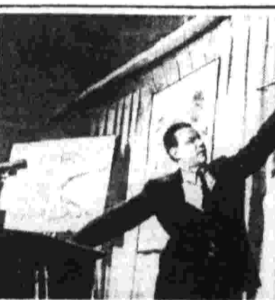
На верхнем снимке: министр обороны США Манганера в правительстве Джонсона...