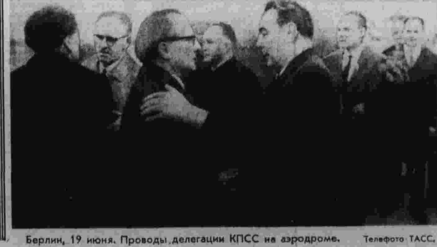
Берлин, 19 июня. Проводы делегации КПСС на аэродроме.