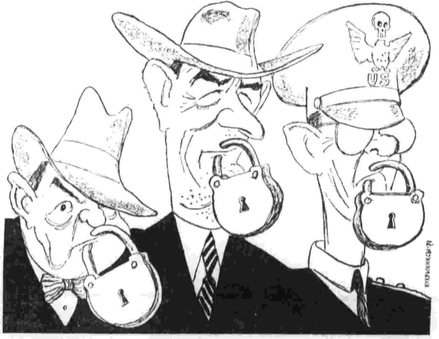
Ключ у Пентагона. Рис. Курмынский.

Мы еще не располагаем таким же количеством документов о дальнейшем периоде, но уже в печати есть немало свидетельств, что камбоджийские и лаосские операции были подготовлены давным-давно и перешли в качестве «исследований» от предыдущей администрации к нынешней. История повторяется в том, что на каждом новом этапе очередные планы агрессора вновь