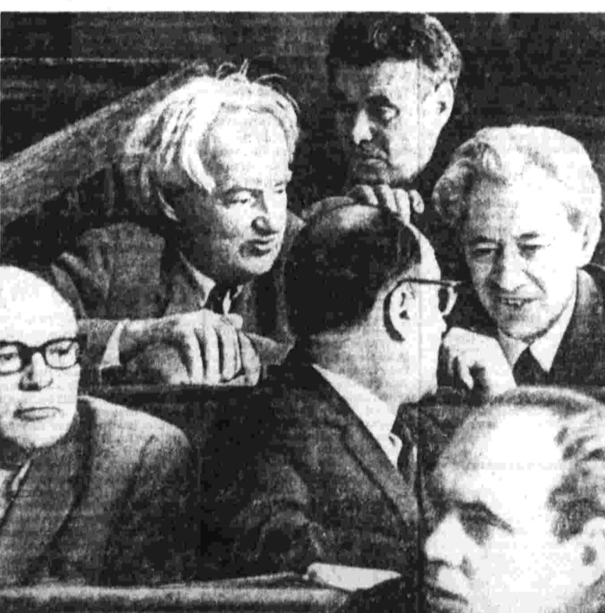
ФОТОКОНКУРС «ПРАВДА-71» За две минуты до начала. (Снимок сделан ассистентом Казанского государственного университета на заседании ученого совета).