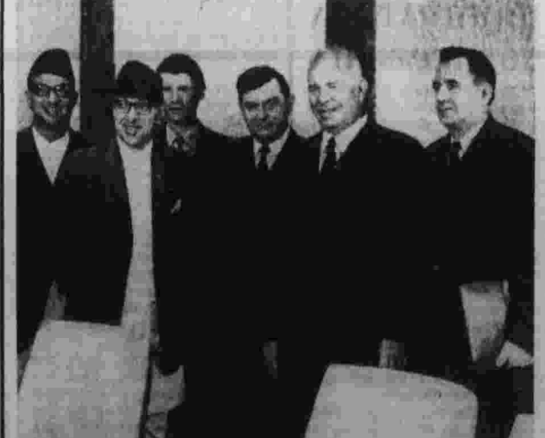
Москва, 15 июня 1971 года. Перед началом переговоров в Кремле.