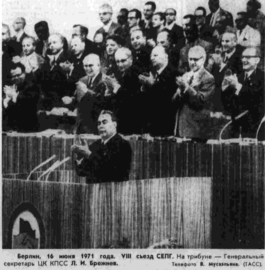
Берлин, 16 июня 1971 года. VIII съезд СЕПГ. На трибуне — Генеральный секретарь ЦК КПСС Л. И. Брежнев.

ЦЕНТР УПРАВЛЕНИЯ ПОЛЕТОМ, 16. (ТАСС). К 12 часам московского времени пилотируемая орбитальная станция «Салют» завершила 148-й виток вокруг Земли. В истекшие сутки полета экипаж станции выполнил технические эксперименты, целью которых являлась отработка новых средств ручного и автоматического управления движением космических аппаратов. В ходе этих экспериментов проверялись возможности ручного управления с помощью микроуправляющего оптического визира и высокоточного оптического построителя вертикали.