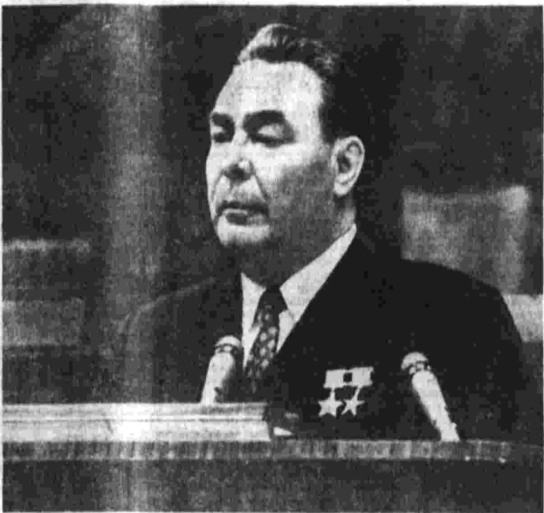
Москва, 11 июня 1971 года. Кремлевский Дворец съездов. Встреча избирателей Бауманского избирательного округа столицы с кандидатом в депутаты Верховного Совета РСФСР товарищем Л. И. Брежневым.