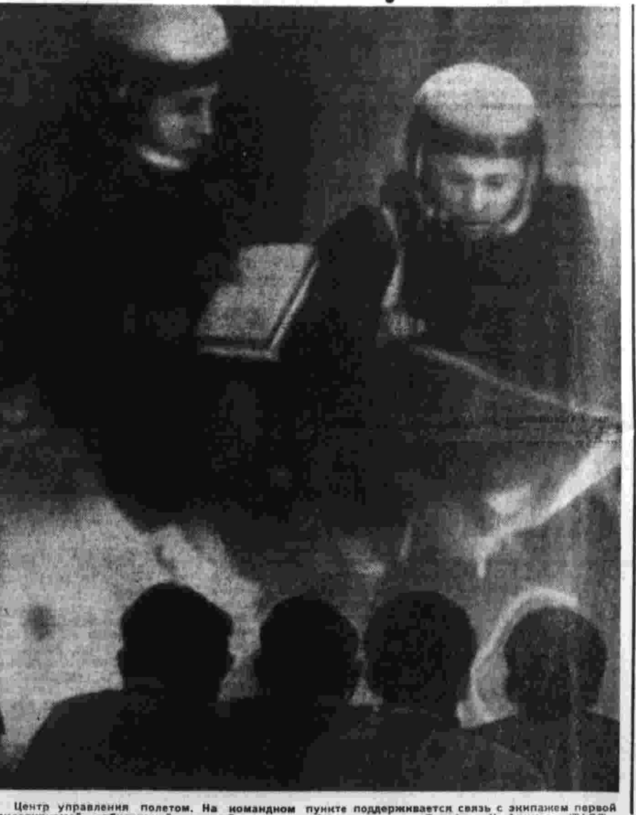
Центр управления полетом. На командном пункте поддерживается связь с экипажем первой пилотируемой орбитальной научной станции «Салют».