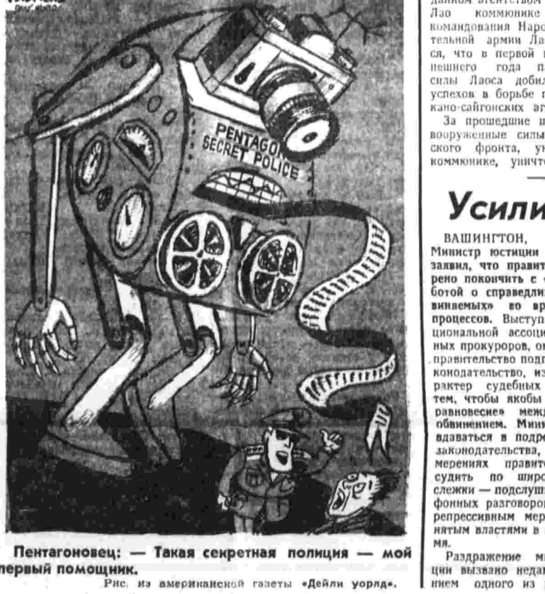
Пентагоновец: — Такая секретная полиция — мой первый помощник.

ХАНОЙ, 10. (ТАСС). В переданном агентством Коасан Патет Лео коммюнике Верховного командования Народно-освободительной армии Лаоса отмечается, что в первой половине нынешнего года патриотические силы Лаоса добились больших успехов в борьбе против американско-сайгонских аггрессоров. За прошедшие шесть месяцев вооруженные силы Патриотического фронта, указывается в коммюнике, уничтожили свыше 31 тысячи солдат и офицеров противника, в том числе 527 американцев, вывели из строя 632 вражеских самолета и 770 военных машин. Успехи народных вооруженных сил, отмечается в коммюнике, вносят значительный вклад в общую борьбу народов стран Индокитая и создают благоприятные условия для достижения полной и окончательной победы над империалистическими аггрессорами и их приспешниками. ВАШИНГТОН, 10. (ТАСС). Министр юстиции Дж. Митчелл заявил, что правительство намерено покончить с «инфляцией безработицы» во время судебных процессов. Выступая перед национальной ассоциацией оружейных прокуроров, он сообщил, что правительство подготавливает законодательство, изменяющее характер судебных процессов с тем, чтобы якобы восстановить равновесие между властью и обвинением. Министр не стал вдаваться в подробности нового законодательства, однако о явном усилии властей можно судить по широким методам слушания — подслушиванию телефонных разговоров — и другим репрессивным мерам, предпринятым властями в последнее время. Раздражение министра юстиции вызвано недавним оправданием одного из руководителей