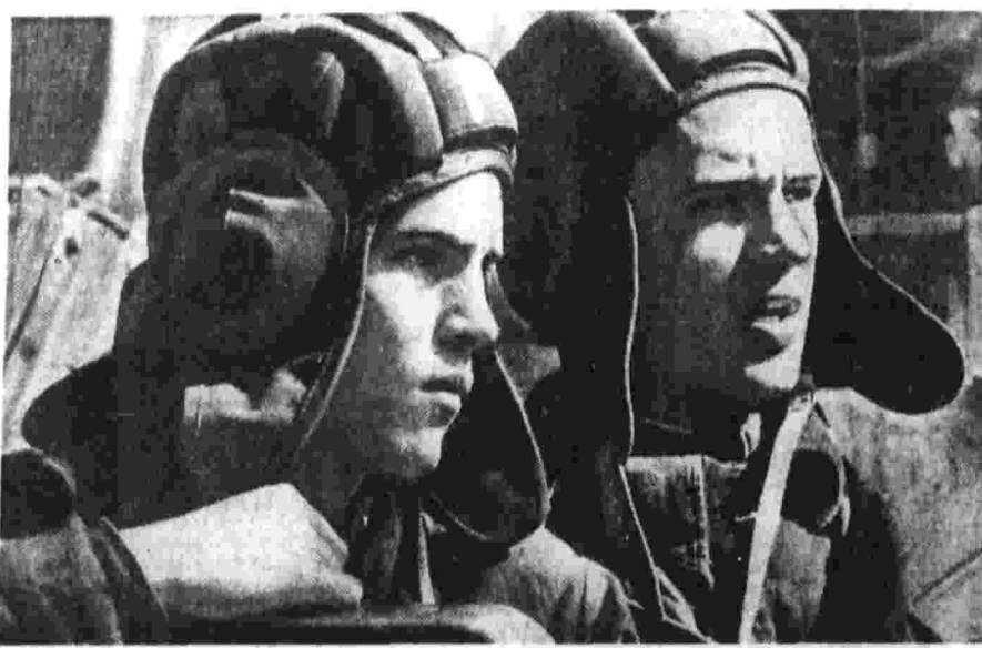
О. ГУСЕВ. (Спец. корр. «Правды»). Район учений «Юг».

Итак, пионерская линия выстроилась в цехе металлургического завода.