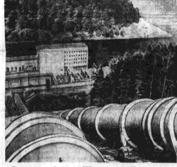
За годы народной власти в ГДР введены в строй огромные энергетические мощности. На с и н и м е: недавно построенная насосно-аккумуляторная электростанция в Бейдфурте.

ВАШИНГТОН, 9. (ТАСС). Фашиствующие молодчики из так называемой «лиги защиты евреев» продолжают свои разнузданные антисемитские выходки против работников советских учреждений в США. Американская газета «Вашингтон инвинг стар» поместила сообщение, что «лига намерена круглоосуточно ливетировать до-