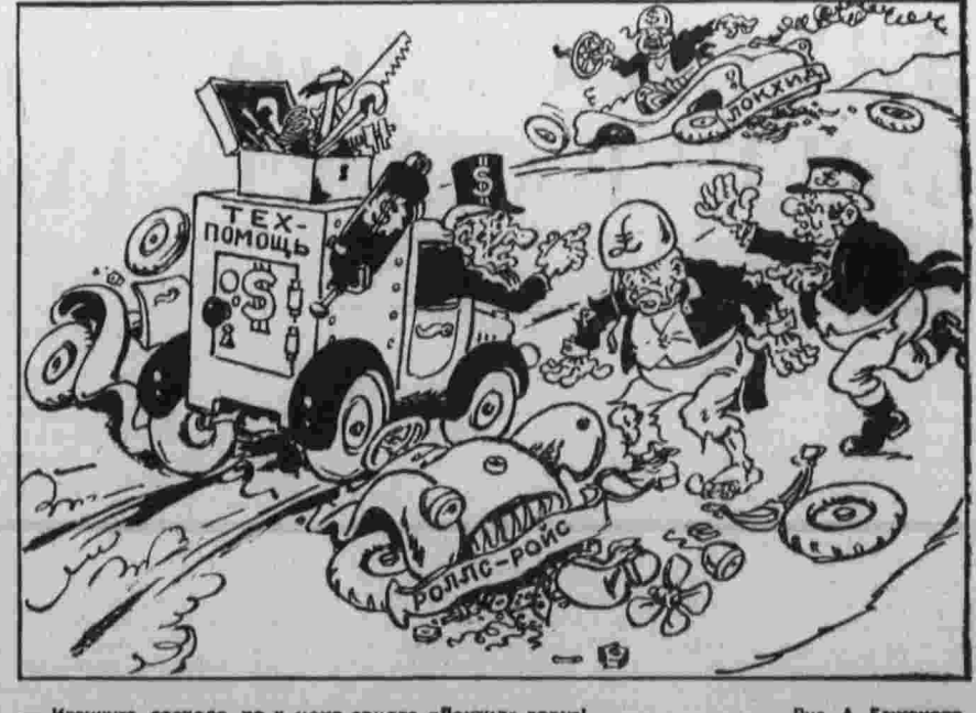
— Извините, господа, но у меня самого «Локкида» горит!.

По законопроекту, внесенному в законодательное собрание штата Иллинойс, муж или жена, вступившие в брак, должны пройти принудительную стерилизацию, если они хотят продолжить получение этого пособия. Законопроект, внесенный в законодательное собрание штата Южная Каролина, требует принудительную стерилизацию для матерей с двумя детьми, получающими пособие.