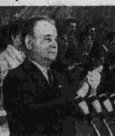
Улан-Батор, 8 июня 1971 года. XVI съезд МНРП. На трибуне — член Политбюро ЦК КПСС, секретарь ЦК КПСС А. П. Кирилленко.

Товарищи! За последнее время в ряде социалистиче-