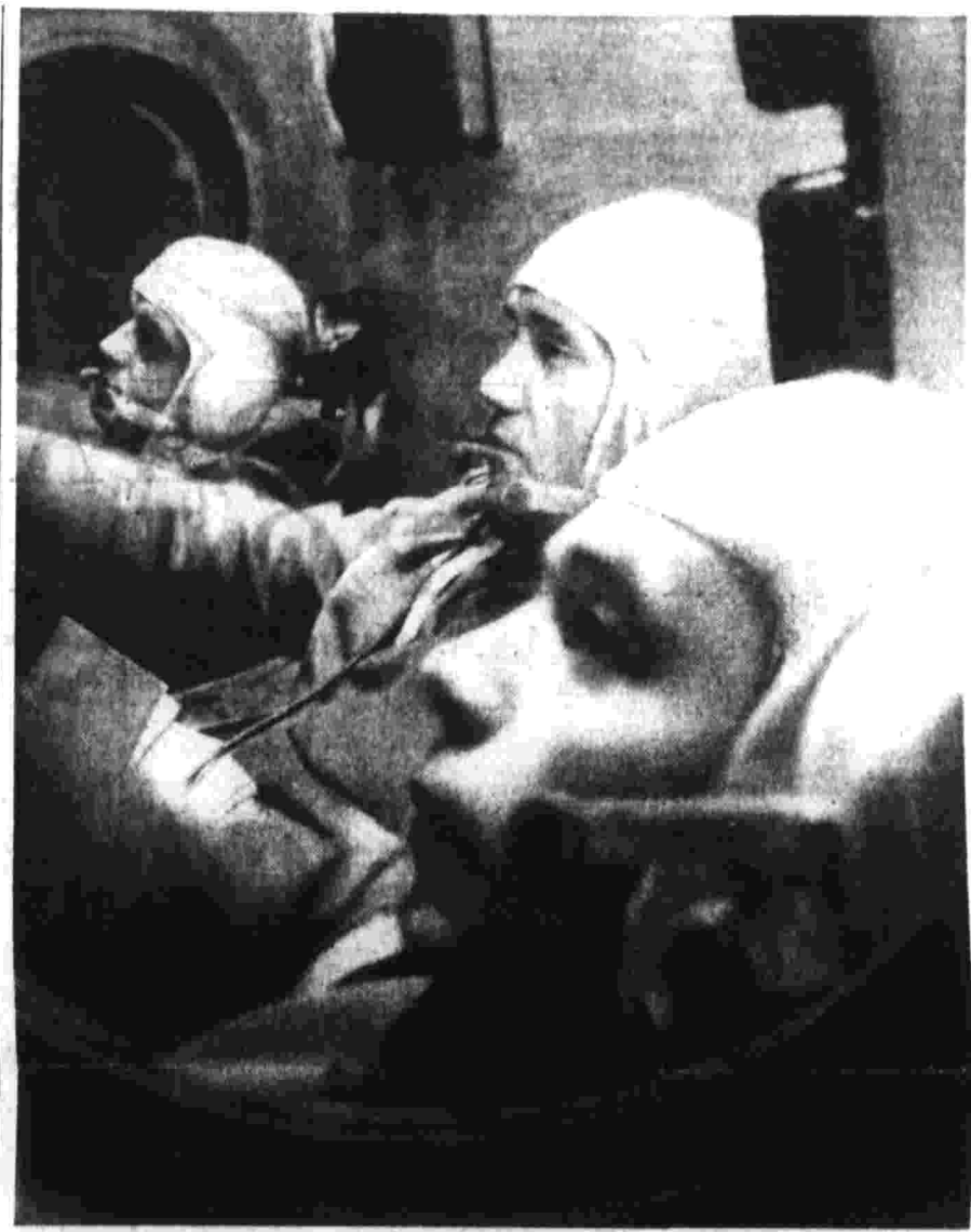
Экипаж космического корабля «Союз-11».

«Салюта» — скорость первая космическая. И ошибиться в метре высоты или метре широты — значит разойтись на космические расстояния. Но стыковка проведена точно: запланированная, рассчитанная, осуществленная высоким мастерством сотрудников наземного центра управления и экипажем корабля «Союз-11».