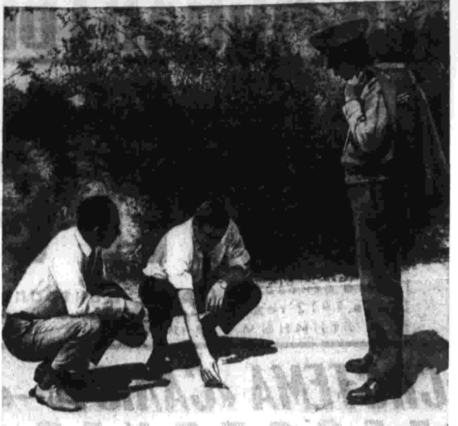
Космические трассы прокладываются на Земле. Космонавты Георгий Добровольский, Владислав Волков и Виктор Пацаев перед полетом.

пятилетке, Проект плана на пятилетку по Москве предусматривает крупные мероприятия по дальнейшему улучшению условий жизни населения на основе сохранения сложившихся высоких темпов жилищного строительства, совершенствования транспортного, медицинского и бытового обслуживания.