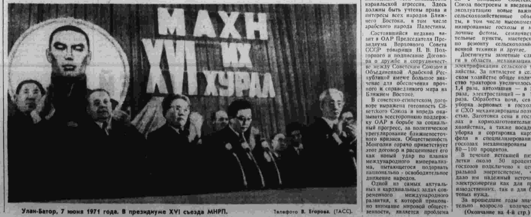
Улан-Батор, 7 июня 1971 года. В президиум XVI съезда МНРП.

За годы четвертой пятилетки с помощью Советского Союза построены и введены в эксплуатацию новые важные сельскохозяйственные объекты, в том числе высококомплексные механизированные хозяйства, а также посадки, уборка и сортировка картофеля в механизированных хозяйствах механизированы на 80—100 процентов.