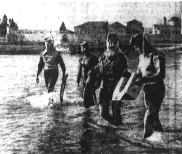
ЕСЛИ среди участников соревнований вы увидите спортсмена с эмблемой спортивного клуба «Воляники» на груди, знайте — это представитель олимпийской физкультурно-спортивной организации завода. Во многих секциях, на базах и спортивных площадках, прославившихся в дни, занимающихся физкультурой этого производственного коллектива, где развито массовое спортивное движение. Есть здесь и мастера спорта.

В. ВОРОНИН. Научный руководитель жспериментальной группы конькобежцев ВНИИФКА.