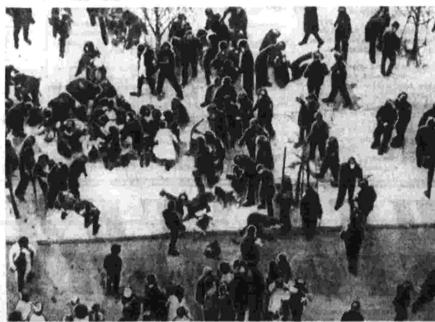
Репрессивные отвечают американские власти на выступления борцов за мир. На снимке из итальянской газеты «Унига» — американский представитель делегации США разгоняют антивоенную демонстрацию в г. Востоне.