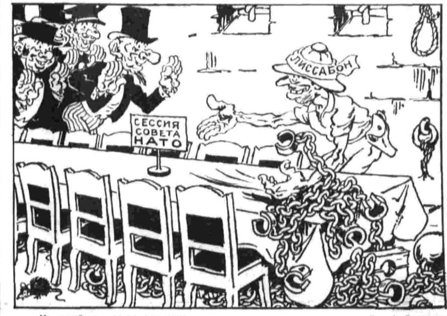
— Не пугайтесь, — здесь все своим...

Конференция обсудит главные задачи организации на 70-е годы, вопросы планирования, координации и финансирования многочисленных проектов по оказанию технической помощи развивающимся странам. В конференции принимают участие делегации СССР, УССР, ВССР.