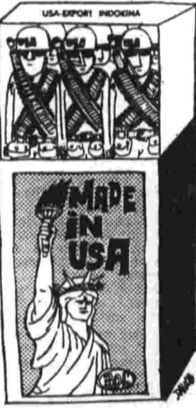
«Сделано в США» для Индонезии. Рис. на датской фольге «Ланд оф голд».

АММАН, 31. (ТАСС). По постановлению суда сообщением, в Гае (окупированная территория ОАР) состоялась демонстрация арабских женщин, протестующих против избиений, которым подвергались жители деревни Вейт-лоха израильскими солдатами во время обстрелов.