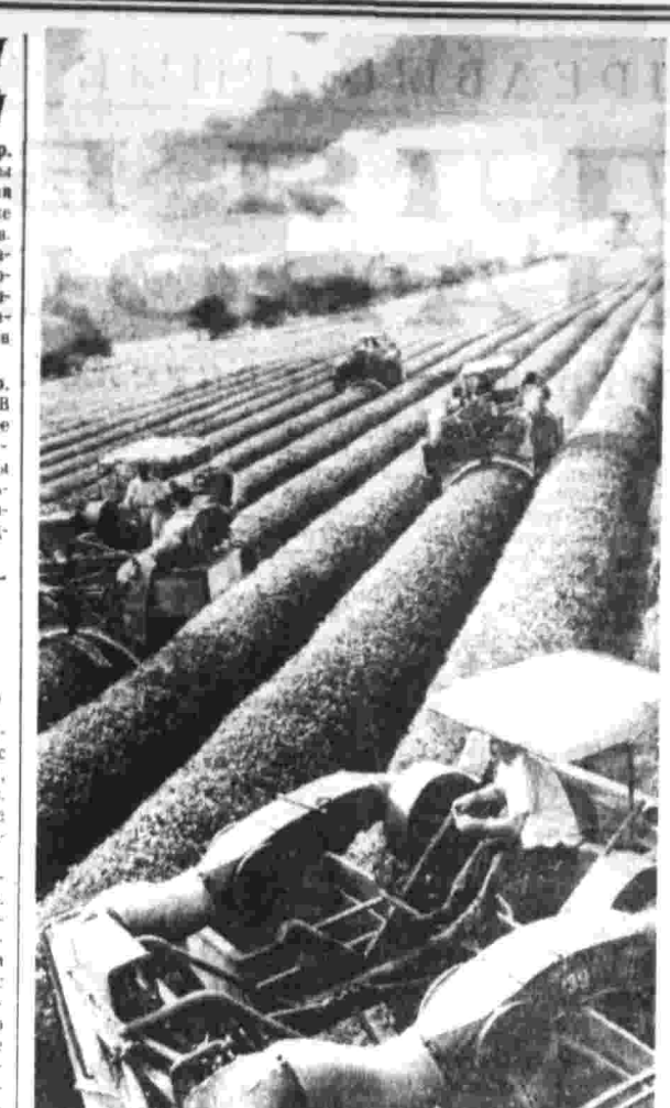
В совхозах и колхозах Грузии продолжается сбор чайного листа. Ингриский совхоз — высоко механизированное хозяйство.

ДНЕПРОПЕТРОВСК, 31. (Корр. «Правды» А. Нижегородов). В Приднепровье прошли теплые майские дожди, наполнились запасы влаги в почве.