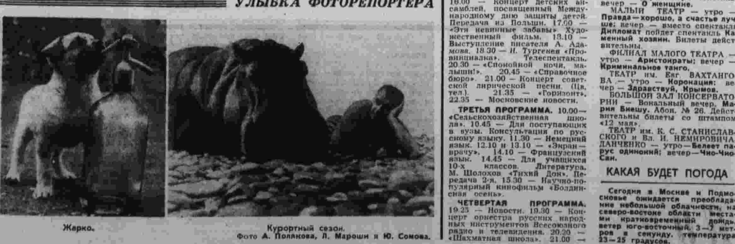
Улыбка фоторепортера. Курортный сезон.

Афиша нынешнего выпуска, по мнению специалистов, была весьма интересной: однанадцать спектаклей. Здесь и «Снегурочка», и «Вечер русских водевйлей», и «Бабы сплетни», и другие. ● ГАСТРОЛИ НАЧАЛИСЬ. Спектаклем «Шорм» В. Билья Белощерковскому начался гастроль Московского академического театра имени Моссовета в Одессе. Зрители будут встречать актеров. Спектакли будут идти на сценах двух театров — оперы и балета и драматического имени Октябрьской революции. Гастроли продлятся месяц. [По сообщениям корр. «Правды» и ТАСС].