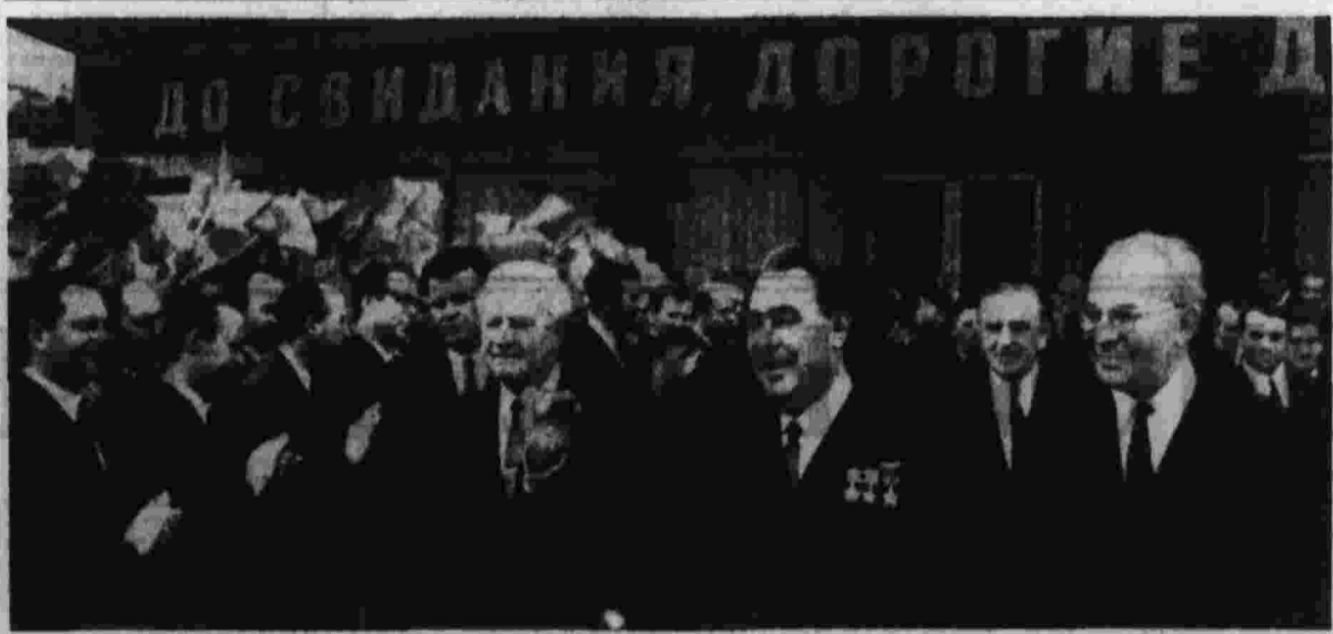
Прага, 29 мая 1971 года. Проводы делегации КПСС на аэродроме.

Затем делегаты единогласно принимают резолюцию XIV съезда КПЧ и директивы по плану пятилетнего плана. С заключительной речью выступает Генеральный секретарь ЦК КПЧ Г. Гусак. (Текст речи публикуется на 4-й странице.) Присутствующие в зале встречают заключительную речь тов. Г. Гусака бурей аплодисментов и одобрительных возгласов. Делегаты и гости в едином порыве стоя скандируют: «КПЧ!», «КПСС!». «Да здравствует Советский Союз!», «Дружба на вечные времена!» Делегаты и гости поют «Интернационал». Съезд объявляется закрытым.