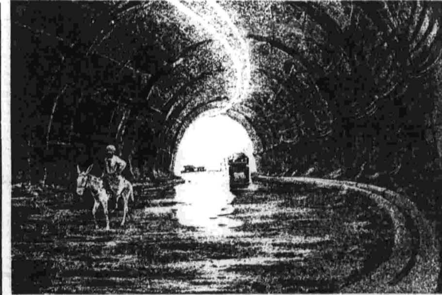
Из альбома художника

ПЕТРОВЗАВОДСК, 29. [Корр. «Правды» В. Логвиненко]. На агробиологической базе Карельского филиала Академии наук СССР завершено сев зерновых культур. Но в борозды легли не обычные семена, а десятки разновидностей злаков — так называемых мутантов. Цель этих экспериментов — найти новые, наследственно-доминантные формы растений, лучшие сорта картофеля и кормовых трав, которые давали бы в условиях Севера высшую урожайность.