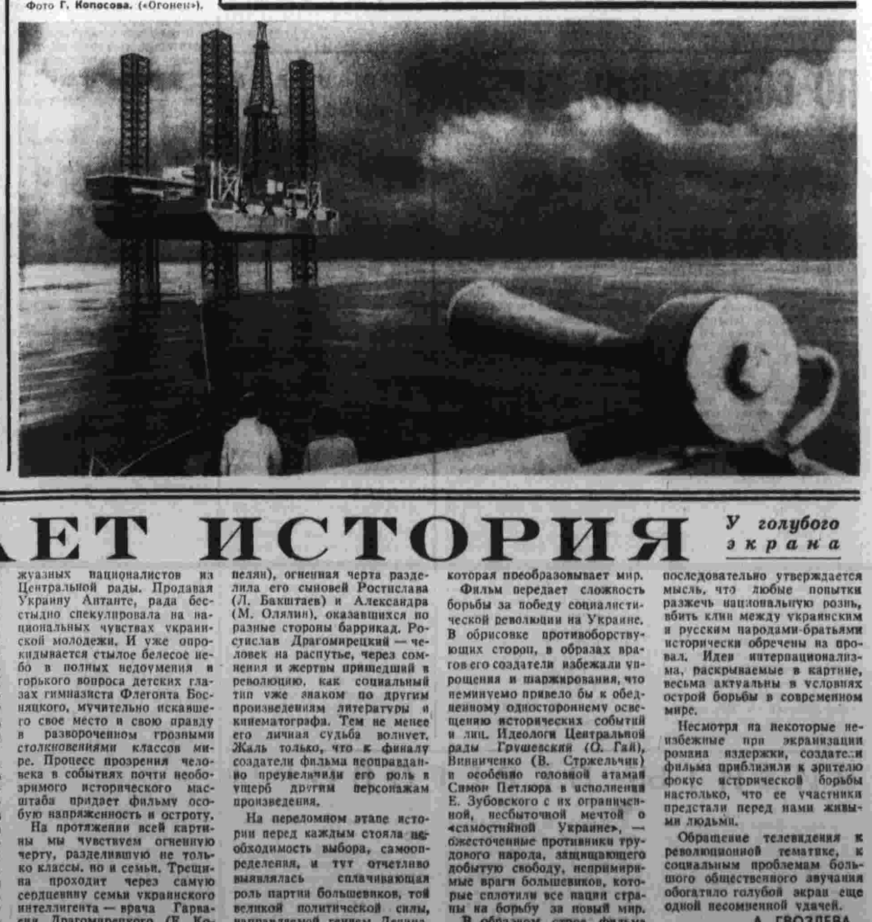
У голубого экрана