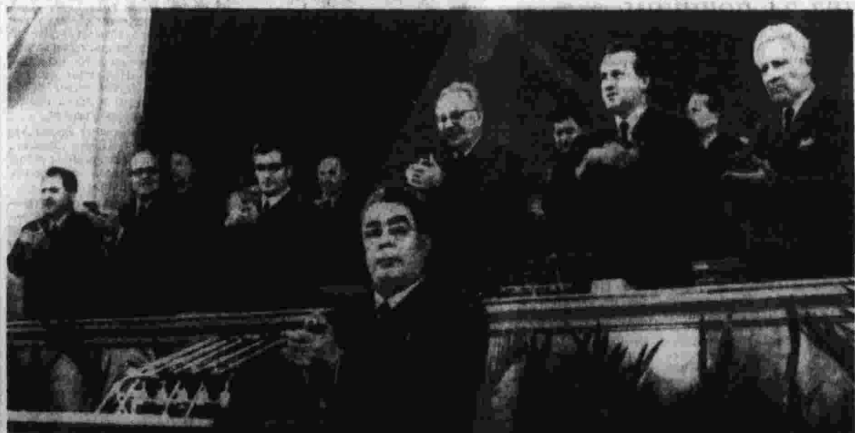
Прага, 26 мая 1971 года. XIV съезд КПЧ. На трибуне — Генеральный секретарь ЦК КПСС Л. И. Брежнев.

Социализм, достигнутые партии вместе с массами, во имя интересов масс. (Аплодисменты).