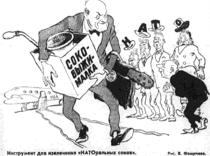
Инструмент для извлечения «НАТО-оральных соков».

Представители Пентагона требуют от своих западноевропейских партнеров по НАТО «дальнейших усилий» в целях наращивания вооруженных сил этой агрессивной блоку. (Из газет).