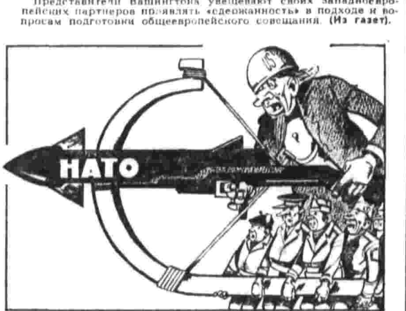
Главный НАТОвский арбелачик: — Полноцение должно оставаться натынутым.