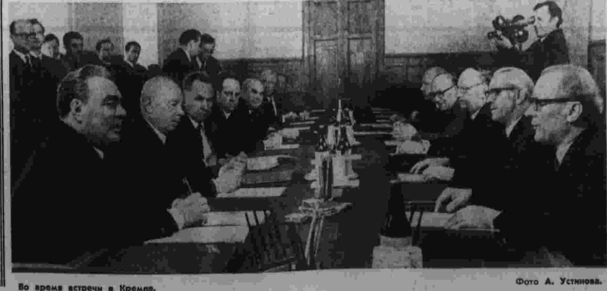
Во время встречи в Кремле.