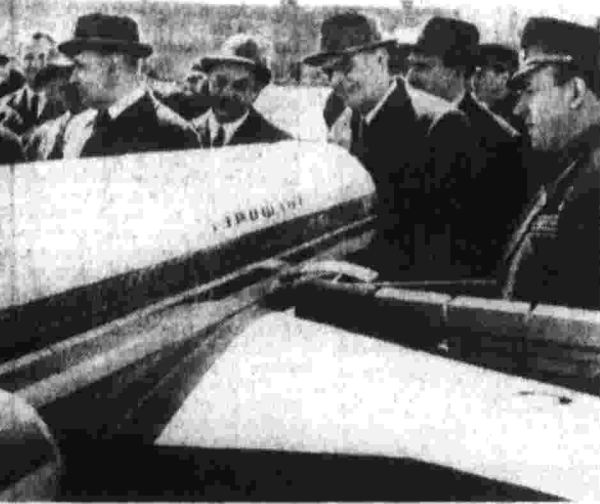
Во время осмотра новых образцов гражданских самолетов и вертолетов в аэропорту «Внуково».