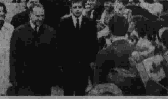
Встреча на Внуковском аэродроме.

Улицы и площади, по которым проезжал Премьер-Министр, были украшены государственными флагами Канады и СССР. Препариантами со словами здравия в честь советско-канадской дружбы.